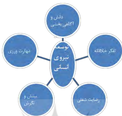
شکل ۱: ابعاد توسعه نیروی انسانی (۱۲،۸،۴)

نگرشی، شغلی، ادراکی، رفتاری، خلاقیتی و دانشی اشاره کرد (۱۲،۸،۴) اشاره کرد (شکل ۱) که سازمان ها بخصوص سازمان های آموزشی باید به توسعه همه جانبه توانایی های ذکر شده بالا توجه نمایند.