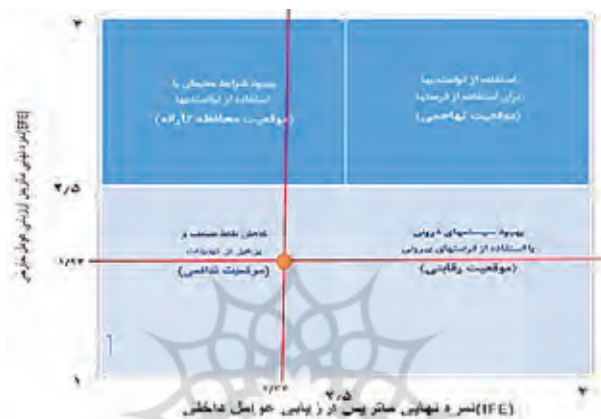
شکل ۲. ماتریس ارزیابی داخلی و خارجی (IE)

WT است. ماتریس IE گویای این واقعیت است که اگر مدیریت شهری بیرجند بخواهد حرکت خود را به سمت برنامه ریزی استراتژیک آغاز کند، پیاده سازی استراتژی های گروه WT یا همان استراتژی های تدافعی، باید در اولویت اول قرار گیرد، یعنی نقاط ضعف را کاهش دهد و از تهدیدها دوری کند.