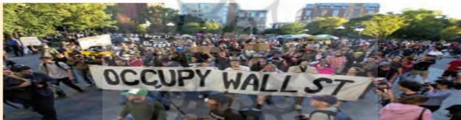
جنبش وال استریت علیه بی‌عدالتی در آمریکا