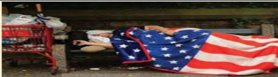
کارتن خواب امریکایی