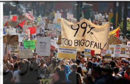
جنبش‌ها و اعتراضات متعدد در آمریکا در اعتراض به بی‌عدالتی‌های گسترده در این کشور