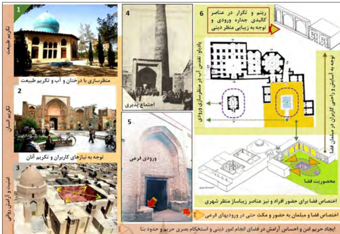
شکل ۳- بازتاب آموزه‌های عام اسلامی در طراحی منظر ورودی اماکن عبادی: ۱. باغ مصلی نایین (نوابی و حاجی قاسمی، ۱۳۹۱: ۳۳۵). ۲. جلوخان ورودی مسجد جامع قزوین (نگارنده). ۳. حسینیه باب المسجد نایین (URL4). ۴. مسجد جامع طبرس (صفاءالسلطنه، ۱۳۸۲: ۱۹۸). ۵. سردر شرقی مسجد امام بروجرد (نگارنده). ۶. مسجد بالامحله محمدیه نایین (نگارنده).