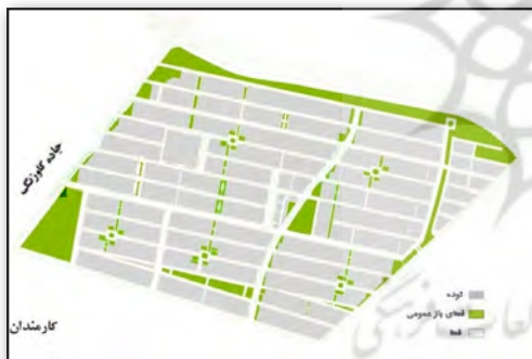
تصویر ۱. فضاهای باز و ساخته شده کوی کارمندان در یک تفکیک شطرنجی. Fig 1. Open and built spaces in Karmandan neighborhood in a grid pattern.