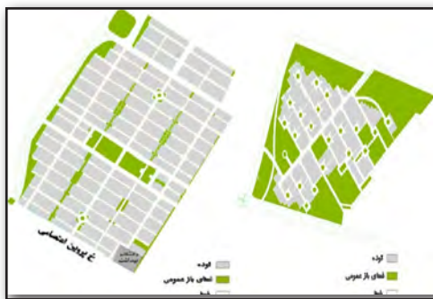
تصویر ۲. تصویر راست: فضاهای باز و ساخته شده کوی علوم پایه در یک تفکیک دوربرگردان. تصویر چپ: فضاهای باز و ساخته شده کوی انصاریه در یک تفکیک ترکیبی. Fig 2. Right-open and built spaces in Olom Paye neighborhood in a cul-de-sac pattern-Left: open and built spaces in Ansariye neighborhood in a grid-cul-de-sac pattern.

نمودار ۲. راست: جایگاه تفکیک اراضی در طرح‌های گسترش موفق جهانی. چپ: جایگاه تفکیک اراضی در گسترش‌های شهری در ایران.