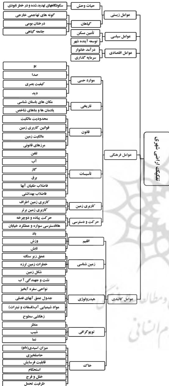
Diagram 1. Influential factors in urban land subdivision in successful global examples.

مسکونی است؛ در حالی که براساس دیدگاهی که در اینجا مورد بحث قرار گرفت، باید آن را مفهومی فراتر از مفهوم یاد شده تلقی کرد (نمودار ۲).