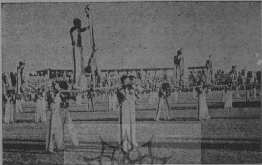
عملیات ورزشی قیپ متو مکانیزه در جشن ورزشی ارتش