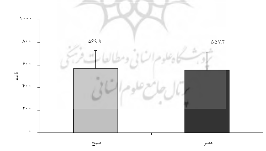
شکل ۳ - میانگین زمان رسیدن به FAT_{max} در دونوبت صبح و عصر