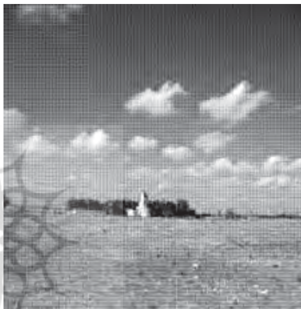
تصویر ۱: بخشی از محوطه ذلف آباد