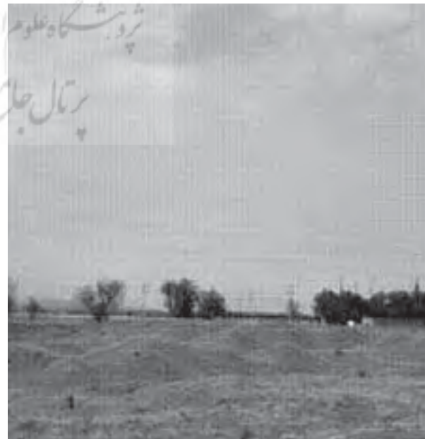
تصویر ۳: بخشی از چاله های حفاری غیر مجاز