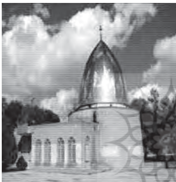
تصویر ۲: امام زاده احمد

۳- ظروف سنگی: بیشتر کاربرد آشپزخانه ای داشته و با نقش