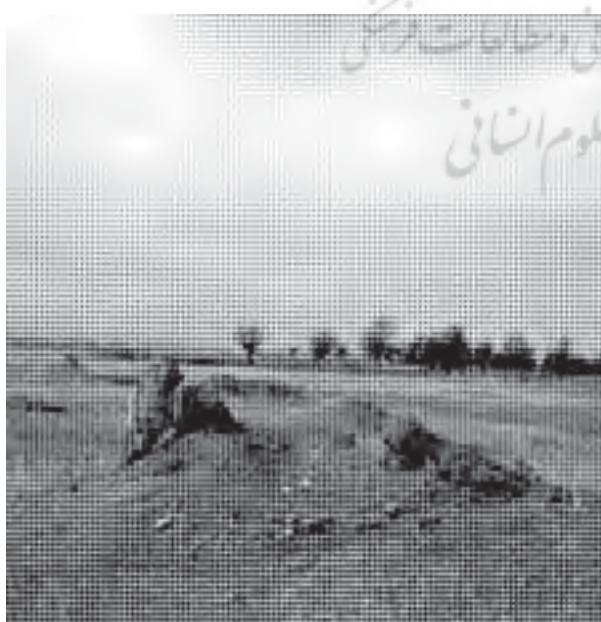
تصویر ۴: بخشی از بنای مخروبه ی منسوب به بل حسین