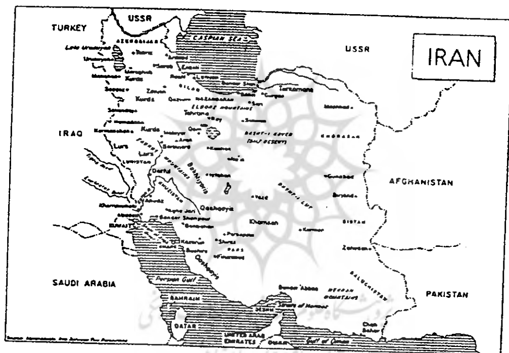
نقشه شماره ۲: ایران در پایان دوران قاجار و آغاز دوران پهلوی (سال ۱۳۰۴ خورشیدی)

(۱۹۶۹) با راهنمایان ایرانی و زیر حمایت ناوچه های جنگی ایران از شط العرب عبور کرد ۱ و ایران عملاً از حقوق قانونی خود در شط العرب - به عنوان رودخانه مرزی - استفاده نمود. در کنفرانس الجزیره در سال ۱۹۷۵، صدام حسین نماینده کشور عراق، به دلیلی که جای بحث آن در این مختصر نیست، به ناچار بر حقانیت ایران در شط العرب صحه نهاد. اقدام دیگر در ۹ آذر ۱۳۵۰ (۳۰ نوامبر ۱۹۷۱)، بازگرداندن جزایر تنب بزرگ و کوچک و ابوموسی در خلیج فارس به ایران بود که به سبب نزدیکی با تنگه هرمز دارای موقعیت استراتژیکی مهمی در این منطقه است. ۲