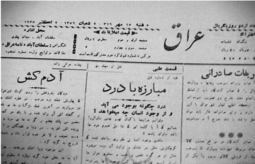
داستان کوتاه آدم گش (نوشته جمال‌الدین عراقی زاده)