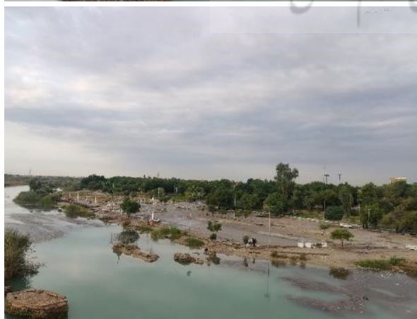
تصویر ۱. تبدیل لبه رودخانه به فضایی شبه‌پارک با عملکرد تفریحی و جدایی آن از زندگی شهری، دزفول، عکس: بابک عبدی، ۱۴۰۳.