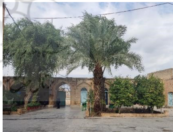
تصویر ۲. کنار و نخل درختان بومی منتخبی که از فضای عمومی تا حیاط خانه‌ها حضور دارند.