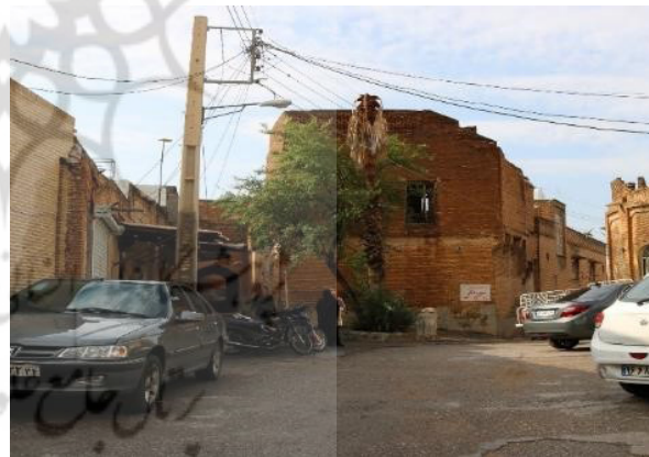
تصویر ۵. کاشت درخت در نقاط عطف شهری. عکس: زینب رضایی، ۱۴۰۳.

جدول ۱. تفاوت ویژگی‌های سبک منظر سبز بومی شهر رودخانه‌های خوزستان با فضای سبز معاصر. مأخذ: نگارندگان.