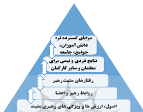
شکل ۳: مدل رهبری مثبت مدرسه

– اقدامات و رفتار مثبت رهبران مدرسه نسبت به دیگر افراد، "تأثیر گسترده بر محیط کار" مدارس، به ویژه روابط مشارکتی معلمان دارد که متعاقباً نتایج مطلوب کار جمعی را افزایش می‌دهد. مورفی به این نتیجه می‌رسد که رهبر مدرسه بر یادگیری دانش‌آموزان زمانی تأثیر می‌گذارد که از توسعه مثبت مدرسه در سطح وسیع حمایت کند، این استدلال، در شکل ۳ نشان داده شده است.