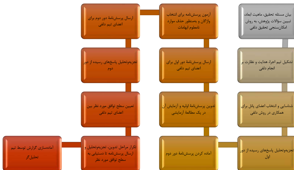
شکل ۱. مراحل انجام روش دلفی فازی Figure 1. The stages of performing the fuzzy Delphi method