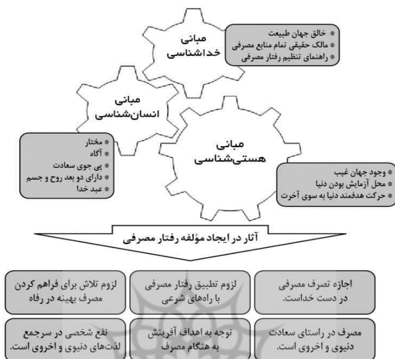
شکل ۲: باور به مبانی فلسفی و تاثیر در الگوی مصرف اسلامی