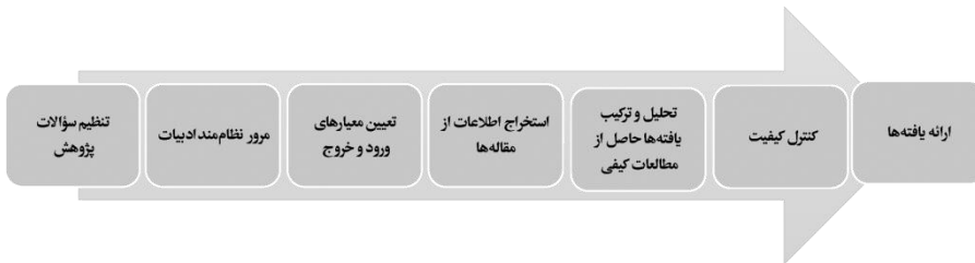
شکل ۱. مراحل و روش کلی فراترکیب ساندلوسکی و باروسو (۲۰۰۷)

به طور فرعی به این موضوع پرداخته اند، تهیه شد. در مرحله دوم، چکیده این مقالات استخراج و مقالات دسته بندی، و در مرحله سوم با استخراج عناصر کلیدی، ترکیب نهایی انجام شد و تحلیل و جمع بندی صورت گرفت. مراحل و روش کلی هفت مرحله ای فراترکیب در شکل ذیل آورده شده است: