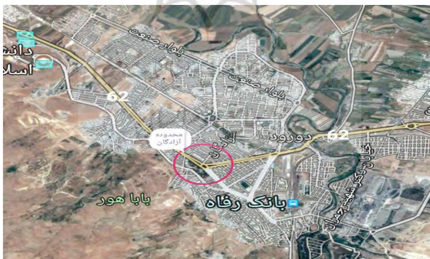
شکل ۱: موقعیت پارک آزادگان شهر دورود

پارک آزادگان شهر دورود در مرکز این شهر و در کوه پایه کوه باباهور مشرف به شهر دورود واقع شده است. دسترسی به این پارک از تمامی نقاط شهر دورود بسیار راحت است. در جوار پارک هتل شهرداری شهر دورود واقع است. قدمت پارک به بیش از ۱۰ سال می رسد. تقریبا مهمترین پارک شهر دورود و بزرگترین آن ها نیز می باشد.