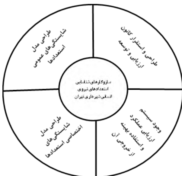
شکل ۲- مدل مفهومی سازوکارهای شناسایی استعداد های نیروی انسانی در شهرداری تهران