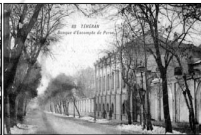
تصویر ۷: نمایی از بانک استقراضی روس