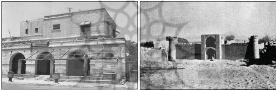
تصویر ۴: نمایی از ساختمان تلگراف‌خانه چاه‌بهار

تلگراف نیز از عناصر جدید الگو گرفته از غرب بود که به اهتمام انگلستان به هدف ارتباط با سرزمین‌های مستعمره خود، در ایران ایجاد شد. این پدیده جدید در ایران، اهداف دربار را در برقراری ارتباط سریع‌تر مرکز با ایالات و ولایات، تقویت تمرکز حکومتی و سرکوب اقدامات ضد دولتی میسر ساخت. از این رو، تلگراف برقی در زمره آن دسته از عناصر تمدن جدید غرب بود که خیلی زود مورد توجه دربار شاهی ایران قرار گرفت. تسریع در ارسال اخبار به اقصی نقاط حکومت ناصری، این حکومت را بر آن داشت تا به سرعت درصدد ایجاد تلگراف‌خانه در ایران برآید. در سال‌های اولیه سلطنت ناصرالدین شاه، در شهر تهران «نخستین خط تلگراف بین شهر و قصر شاه کشیده شد.» ۳ با ایجاد ساختمان‌های تلگراف‌خانه‌ها در شهرها، این بنا نیز در فضای کالبدی شهر ایرانی نمایان شد و در کنار سایر بناهای سنتی، توجه سیاحان را به خود جلب کرد و در نوشته‌های خویش از آن یاد کرده‌اند.