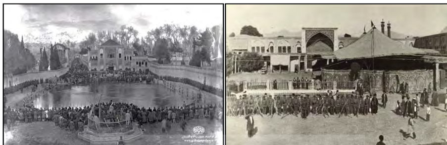
تصویر ۱۰: میدان ارگ تهران

سیاحان غربی در توصیف شهرها از مراکز آموزشی و مذهبی آنها نیز یاد کرده‌اند. برای نمونه در تهران عصر ناصری از ۱۷ مدرسه و ۱۱ مسجد بزرگ و چهار امامزاده که زیارتگاه مردم بوده‌اند، یاد شده است: محله سنگلج ۶ مدرسه و ۲ مسجد؛ محله بازار ۵ مدرسه و ۴ مسجد؛ محله عودلاجان ۴ مدرسه و ۳ مسجد؛ محله ارگ ۲ مدرسه و ۱ مسجد؛ محله چاله میدان ۱ مسجد بدون مدرسه. ۱ همچنین اشاره شده که در زمان ناصرالدین شاه در نزدیکی ساختمان سفارت روس در شمال ارگ، ساختمان دارالفنون احداث شد. در وسط این ساختمان مستطیل شکل، حیاطی وسیع با یک حوض بزرگ قرار داشت و در اطراف آن حدود چهل اطاق به‌عنوان کلاس درس بنا کردند. ۲