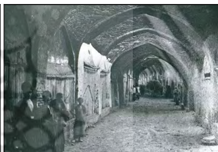
تصویر ۵: نمایی از بازار تهران