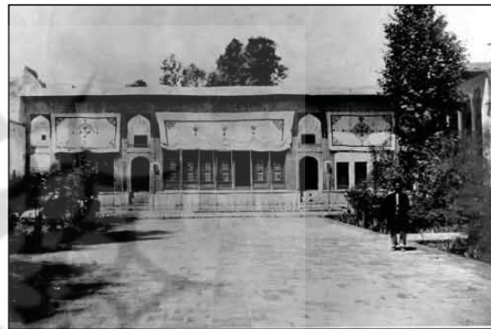
تصویر ۱: نمایی از ارگ شهر مشهد ۴