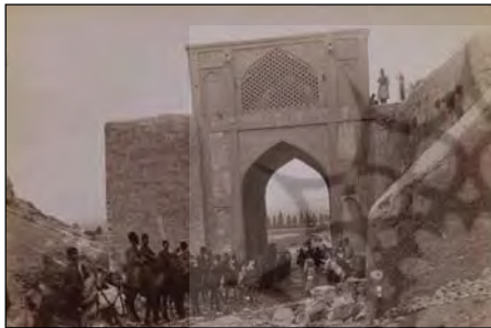
تصویر ۲: نمایی از دروازه قرآن شیراز

لازم به تأکید است که برج و باروی شهر از آغاز دوره ناصری رو به تخریب نهاد. این تخریب ابتدا در تهران با اقدام ناصرالدین‌شاه در ۱۲۸۴ق. برای توسعه این شهر رخ داد که به واسطه افزایش جمعیت آن، این توسعه به نظر اجتناب‌ناپذیر می‌آمد. دست‌اندرکاران و کارگزاران، تمام برج‌ها و باروها و استحکامات دفاعی سابق را خراب و خندق را پر کردند و مساحت شهر را افزایش دادند. ۳ از این تاریخ به بعد، برج و بارو در تمام شهرها از اهمیت و اعتبار خود خارج می‌گردد و شهرسازی عهد پهلوی نیز در تسریع روند آن مؤثر بود.