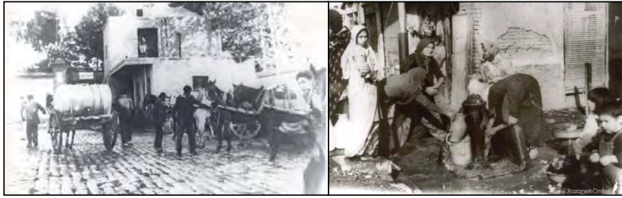
تصویر ۱۱: نظام آبرسانی شهر تهران در دوره قاجار