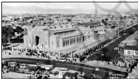
صویر ۸: نمایی از بانک شاهی، میدان توپخانه

بدین ترتیب در تهران و دیگر شهرها شعبات بانکی احداث گردید و «در سال ۱۸۹۰ م / ۱۳۰۸ ق اسکناس های جدید با خط فارسی و علامت شیر و خورشید در یک طرف و عبارت انگلیسی و عکس شاه در سمت دیگر با ارزش یک تومان تا هزار تومان» ۲ منتشر شد. با تأسیس بانک در ایران، این بنا به عنوان تأسیساتی جدید در فضای کالبدی شهر عصر ناصری نمایان شد و در گزارش های سیاحان از آن یاد شده است. ساختمان های بانک شاهنشاهی انگلیس و بانک استقراضی روس در تهران از این نمونه اند. در سیمای شهرهای سنتی ایران، چنین بنایی وجود نداشته است. این قاعده شامل دیگر مؤسسات تمدنی جدید نیز می شود.