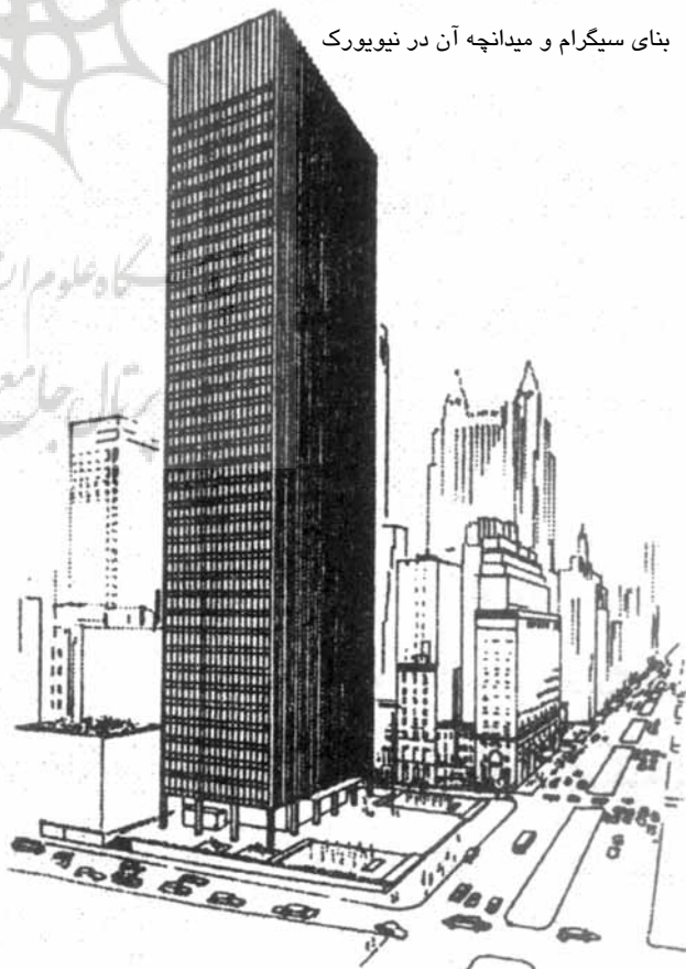
بنای سیگرام و میدانچه آن در نیویورک

یکی دیگر از دیدگاه‌های کل‌گرا در شهرسازی رویکرد زمینه‌گرایی است که به زمینه به عنوان رویدادی تاریخی نگاه می‌کند. زمینه‌گرایی ابتدا به ابعاد صرفاً کالبدی توجه داشت، اما در سیر تکاملی خود زمینه‌ی انسان‌گرایانه را نیز دربر گرفت و حوزه‌ی مطالعات خود را به وجوه اجتماعی - فرهنگی گسترش داد. نویسنده وجه کالبدی این رویکرد را مورد توجه قرار می‌دهد. سپس زمینه‌ی انسان‌گرایانه و آرا راجر ترانسیک بررسی می‌شود که طبق این آرا با پیشنهاد رویکرد منسجم، گذر از ملاحظات شکلی به این عرصه‌ها میسر شده است. زمینه‌ی تاریخی و زمینه‌ی اجتماعی - فرهنگی در ادامه‌ی فصل مورد توجه نویسنده قرار گرفته است. فصل پایانی نیز پیشنهادهایی برای شهرسازی انسجام‌بخش است.