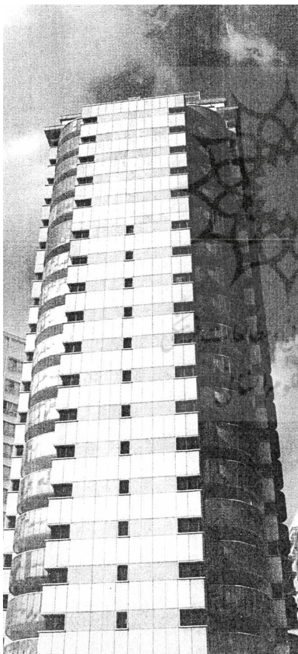
۳- برج مسکونی واقع در تقاطع خیابان کامرانیه و خیابان شهید لوساسانی، تهران

در آغاز دوره‌ی انقلاب اسلامی، افراد به سبب کاهش ارتباطات فرهنگی (و اقتصادی) با غرب، از سبک‌های قبل از انقلاب متأثر شدند و تقریباً پس از جنگ یعنی حدود سال‌های ۷۵-۱۳۶۵ اشخاص متمول از بناهای عمومی شامل ساختمان‌های بیمه و به ویژه بانک‌ها که در این سال‌ها ساخته شدند، تقلید و اقتباس نمودند. این ساختمان‌ها که بناهای