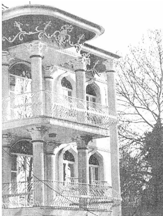
۴- بنایی مسکونی در الهیه

باقر آیت... زاده شیرازی و مدیریت انتشارات و تولیدات فرهنگی، گردآورنده. مجموعه مقالات دومین کنگره تاریخ معماری و شهرسازی ایران، تهران: سازمان میراث فرهنگی کشور، ج ۳، چ اول، ۱۳۷۹.