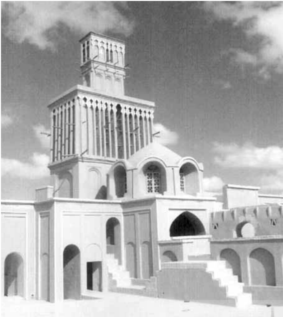
نمایی از پشت بام خانه‌ی آقازاده در ابرکوه

۱۳۸۰ و ۱۳۸۲ به جای استفاده از ناودانک‌های سفالی، در بادگیر با ستون خیس شونده، از پرده‌هایی از جنس گونی و کتان و در بادگیرهای با سطوح خیس شونده از پوشال‌های مصرفی در کولرهای آبی استفاده شد. بررسی تجربی همان طور که گفته شد در سه شهر لنده، مجتمع عصر انقلاب و مسجد دانشگاه یزد انجام گرفت. در بررسی تجربی دو محل اخیر، سه بادگیر مورد آزمایش کاملاً در کنار یکدیگر و بادگیر سنتی در وسط دو بادگیر جدید بود. در بررسی تحلیلی - عددی هر بادگیر به طور مستقل مورد مطالعه قرار گرفت. در هر بررسی ابعاد و اندازه‌ی بادگیرها برابر و از هر نظر شبیه به یکدیگر بودند. به گفته‌ی مؤلفان نتایج بررسی‌ها نشان دهنده‌ی مزیت طرح‌های مربوط به بادگیرهای جدید، به لحاظ میزان هوارسانی به ساختمان و سرمایه‌ی تبخیری هوا، نسبت به بادگیرهای متداول یا سنتی بوده است. مقایسه‌ی بادگیرهای جدید نیز بیانگر مزیت نسبی استفاده از پرده در بادگیرهای جدید است. مؤلفان در عین حال متذکر می‌شوند که استفاده از پرده در بادگیرهای جدید، مستلزم وجود یک پمپ آب نسبتاً قوی است و به نظر افزایش هزینه ساخت می‌تواند به عنوان یکی از معایب به‌شمار رود. بنابراین استفاده از پوشال، به دلیل امکان جمع‌آوری آب اضافی زیرپوشال‌ها در یک مخزن و بهره‌گیری از یک پمپ آب کوچک به منظور هدایت مجدد آب به بالای پوشال‌ها، برای استفاده در بادگیرهای جدید توصیه می‌شود.