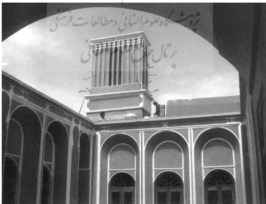
بادگیر بازسازی شده‌ی خانه زرگرباشی در یزد

با اینکه از قدمت بادگیرها آگاهی چندانی در دست نیست، اما نویسندگان با توجه به آشنایی ایرانیان باستان به ویژگی‌های جریان هوا و کاربرد بادگیرها از دیرزمان، اختراع آن را به ایرانیان نسبت داده. روزنتال اختراع این سازه را به ایران نسبت داده‌اند که در روزگار خلافت عباسیان محدود به بین‌النهرین بوده است. به نظر روزنتال اهمیت سیاسی و اقتصادی مصر در دوره‌ی حکومت فاطمیان، در آن منطقه رواج یافته است. آن گاه نویسندگان به پیشینه‌ی بادگیرها در متون ادبی و در سفرنامه‌ی