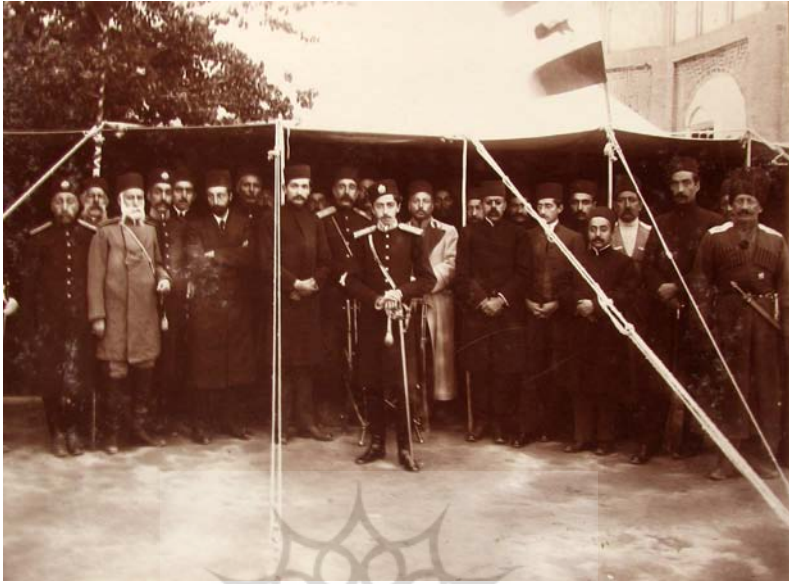
میدان مشق تبریز ۱۳۳۳.