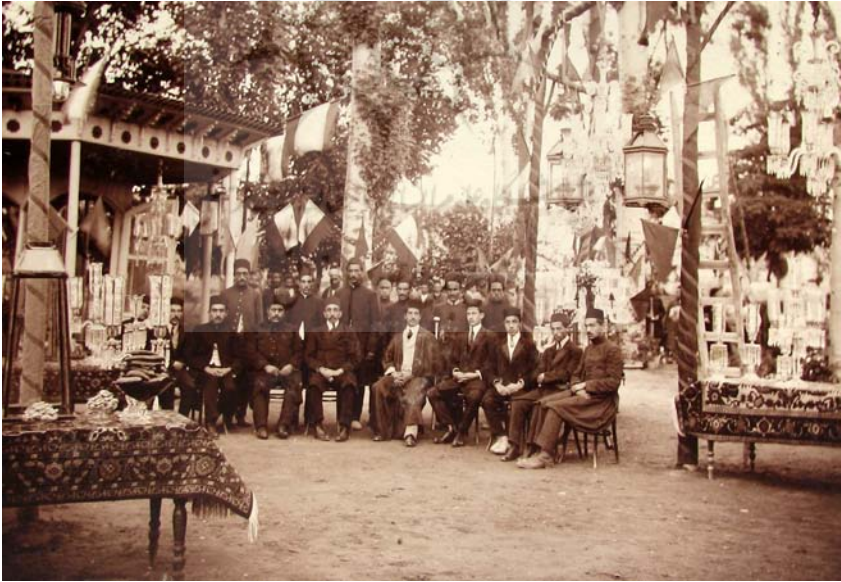
تبریز، در عیدشاه، نظارت‌خانه سرکاری، شعبان ۱۳۳۳.