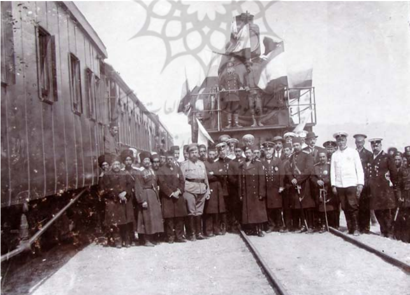
تبریز، افتتاح راه آهن.