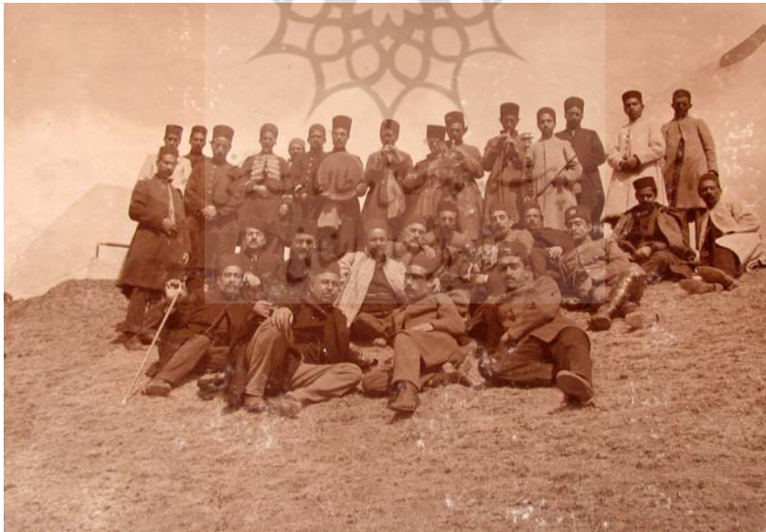
در اهر قراچه داغ، جمادی الثانی ۱۳۳۴.