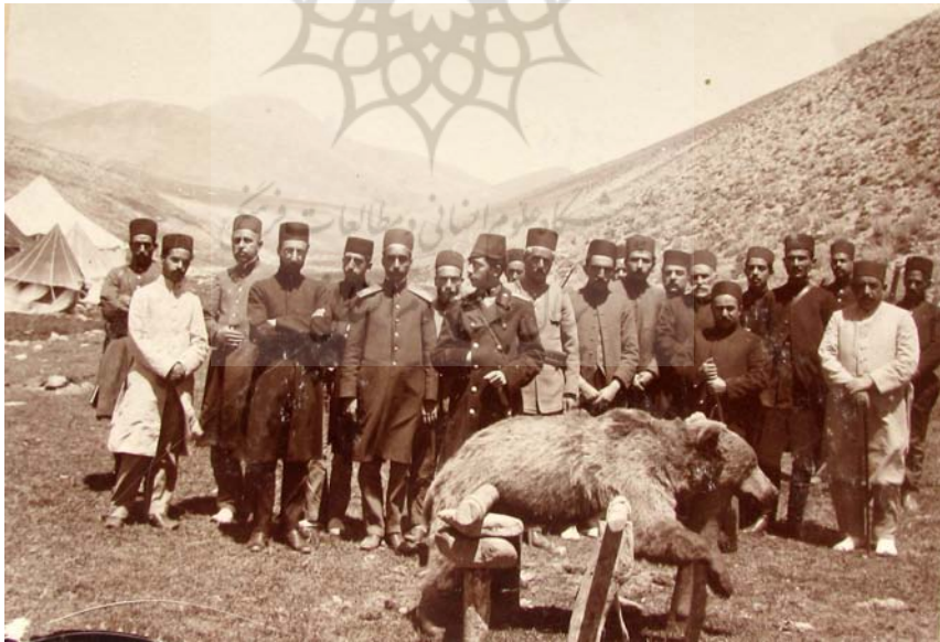
بایندور وخرسی که شکار شده است.