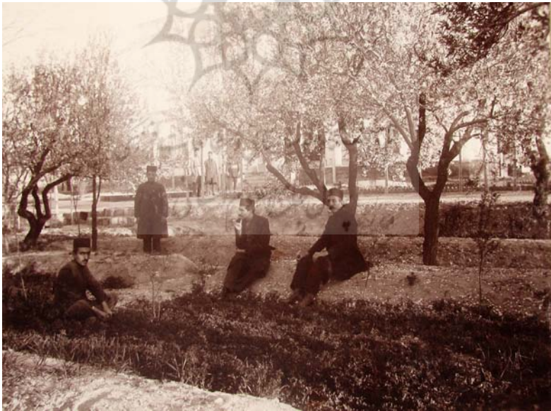
باغ سردار رشید پیشکار کل آذربایجان، ۱۳۳۳.