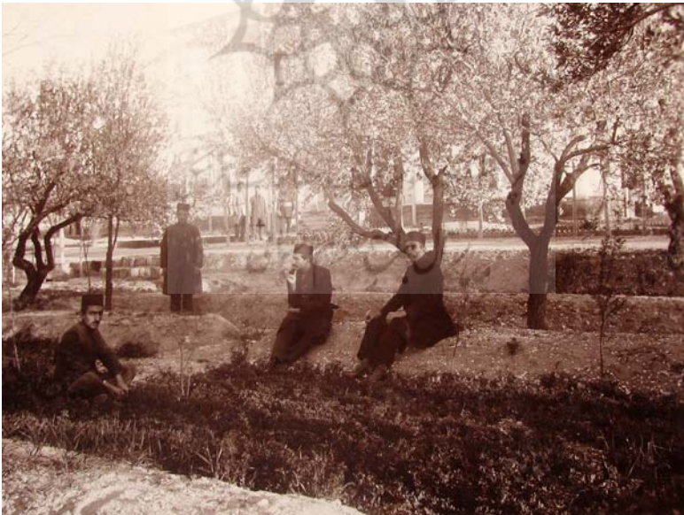
باغ سردار رشید پیشکار کل آذربایجان، ۱۳۳۳.