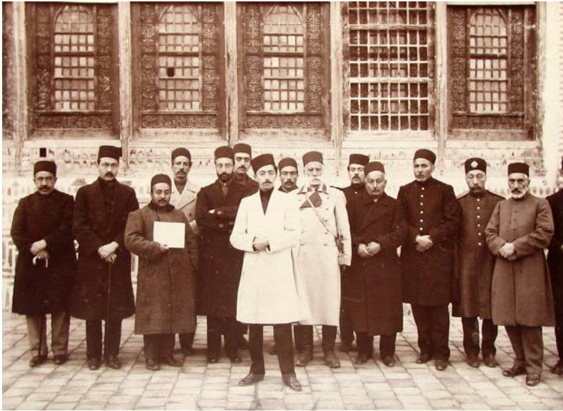
اهر، قراجه‌داغ که شاهزاده محمود میرزا حامل خلعت حضرت رضا صلوات‌اله والسلام علیه بودند. جمادی‌الثانی ۱۳۳۴.