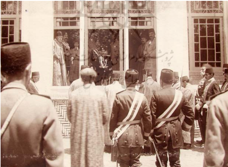
تبریز، سلام در عالی قاپو، ۱۳۳۳.