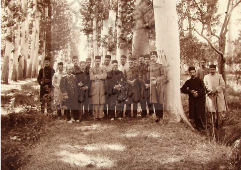
آذربایجان، در باغ ملک... شعبان ۱۳۳۴.