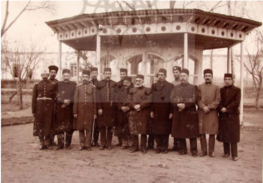
تبریز، عالی قاپو، در رجب المرجب ۱۳۳۳.