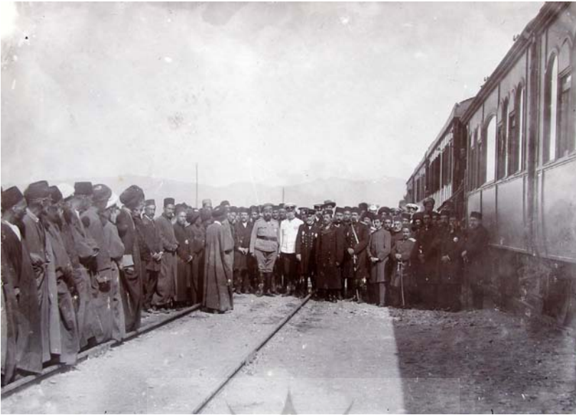
والاحضرت اقدس در موقع بازدید خطوط راه آهن آذربایجان.