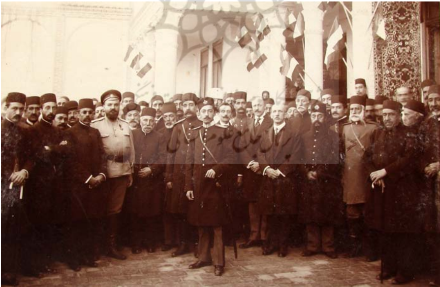
تبریز، کارگزاری، روز افتتاح دارالعجزه.