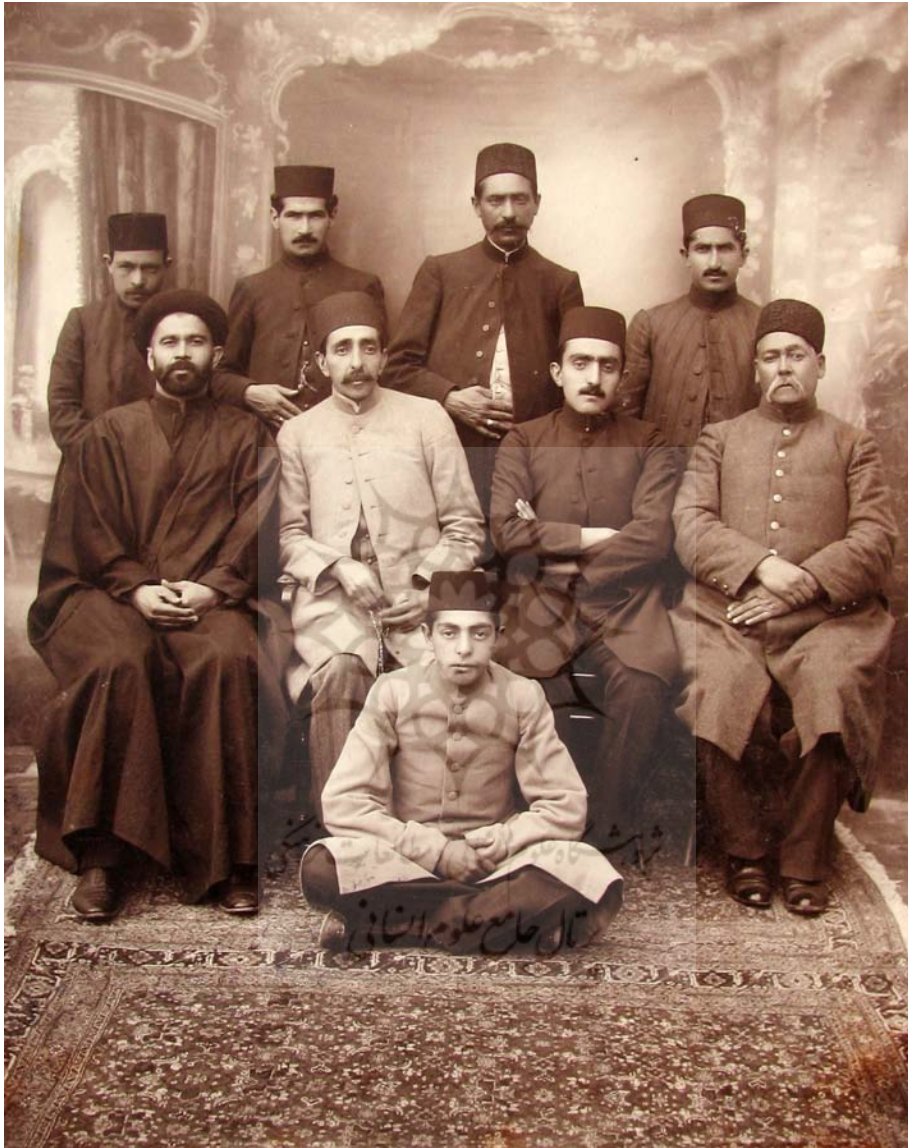
پیام بهارستان / ۲۵، س. ۲، ش. ۸ / تابستان ۱۳۸۹

صارم الممائلک مراغه، احمد میرزاه، ابوالفتح میرزاه، شاهزاده معزالدوله، ناصرالسادات.