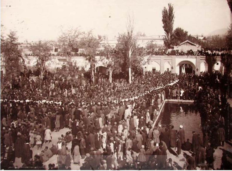
تبریز، روز عاشورا در میدان توپخانه ۱۳۳۴.