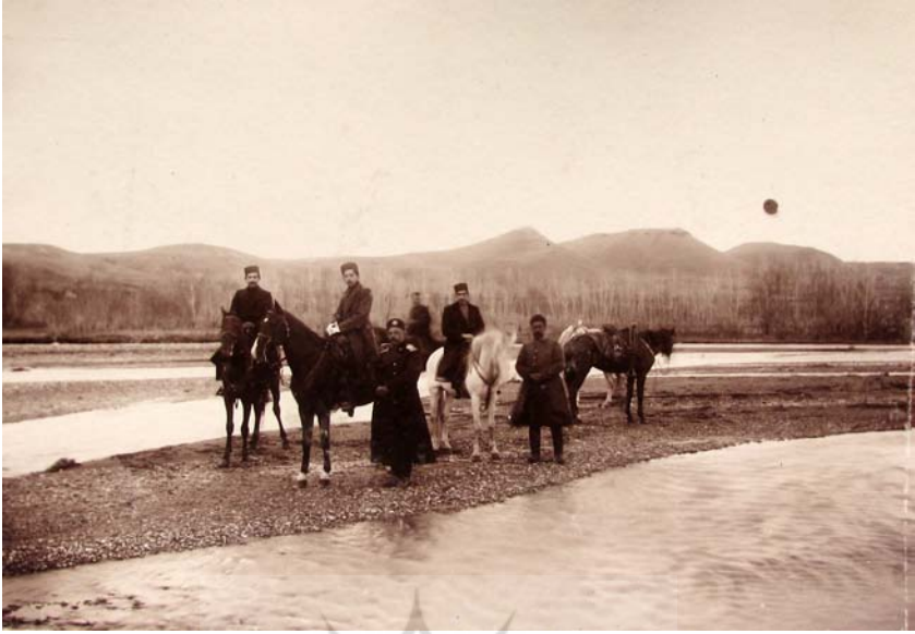
راه زنجان و تبریز در نیکسالی [؟] جمادی‌الثانی ۱۳۳۳.