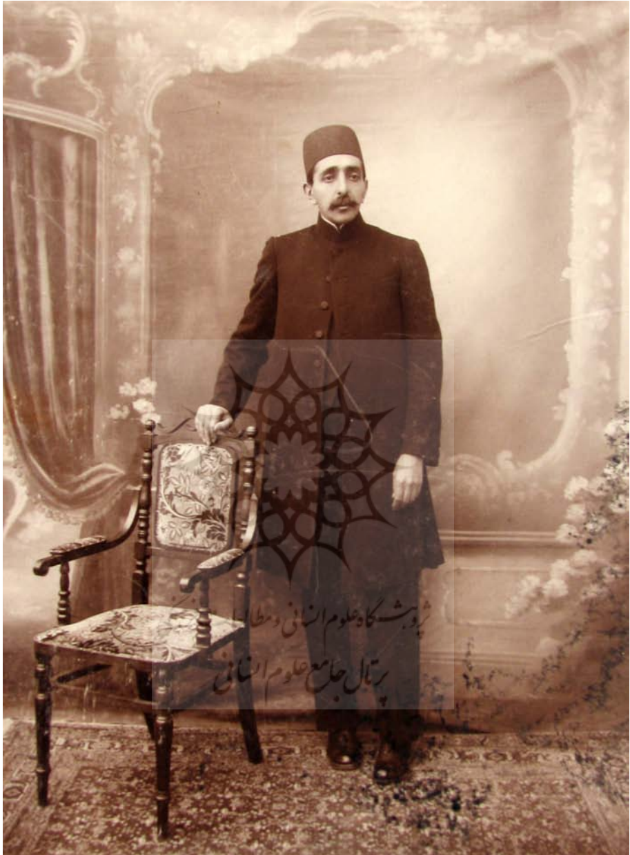
[محمدصادق میرزا معزالدوله] این عکس در پنجاه و چهار سالگی در تبریز یوسفخان عکاس‌باشی انداخته. در سنه ۱۳۳۷.