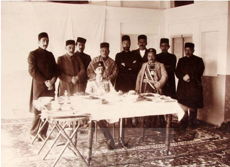
اهل در قراجه داغ روز عید نوروز ۱۳۳۴.