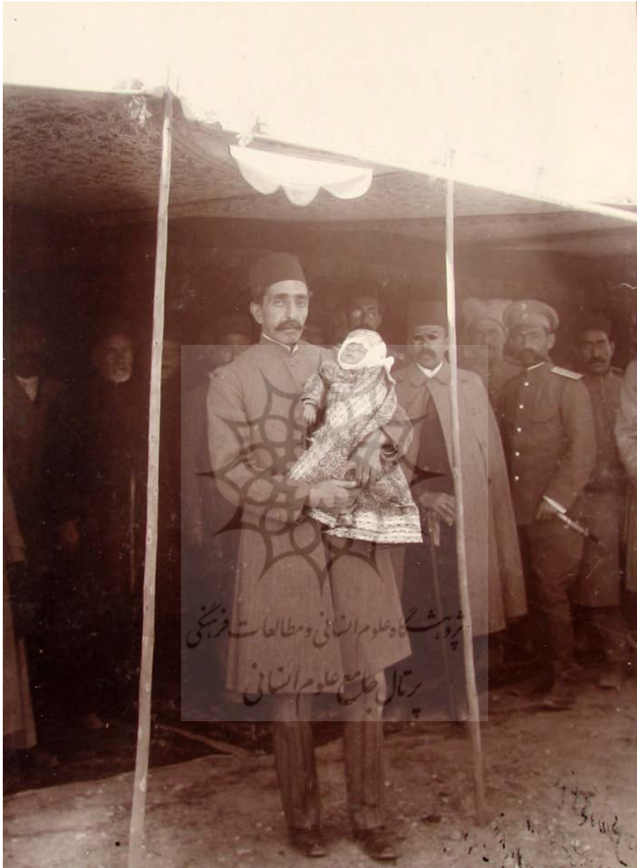
شاهزاده محمدحسین میرزا روز عزیمت به اُدسا.