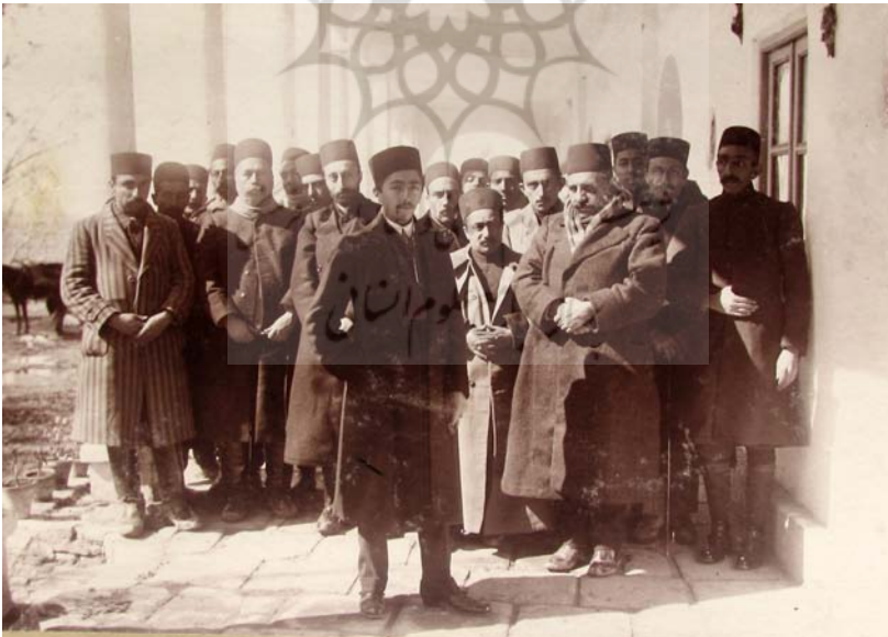
بین طهران و قزوین مهمان‌خانه حصارک، جمادی‌الثانی ۱۳۳۳.