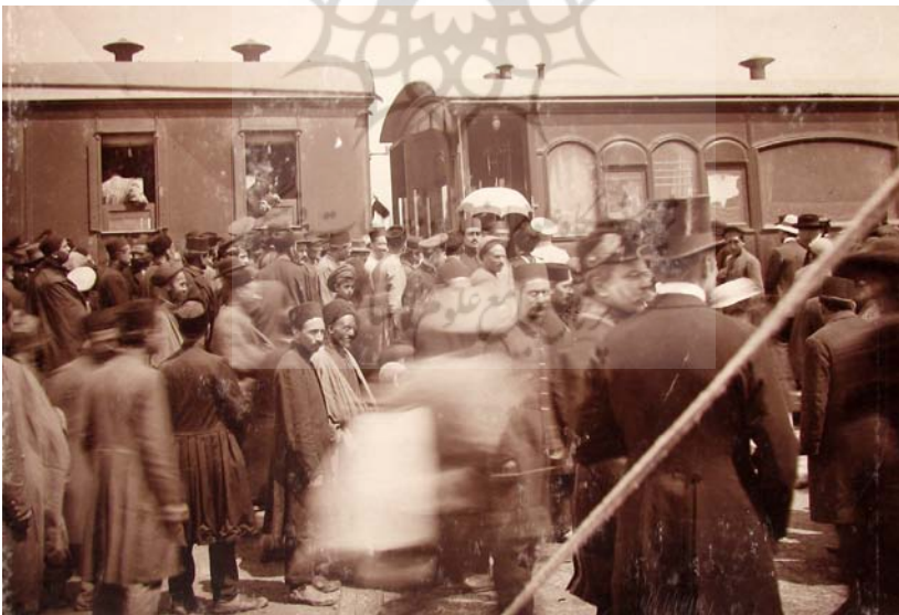
ورود جناب معاون جانشین قفقاز در افتتاح راه آهن تبریز، رجب‌المرجب ۱۳۳۴.