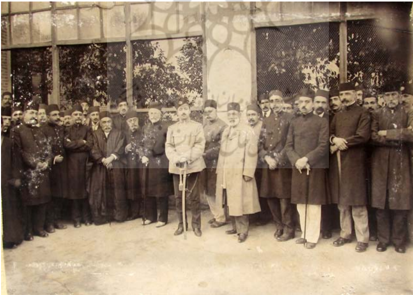
روز مهمانی سپهسالار اعظم.