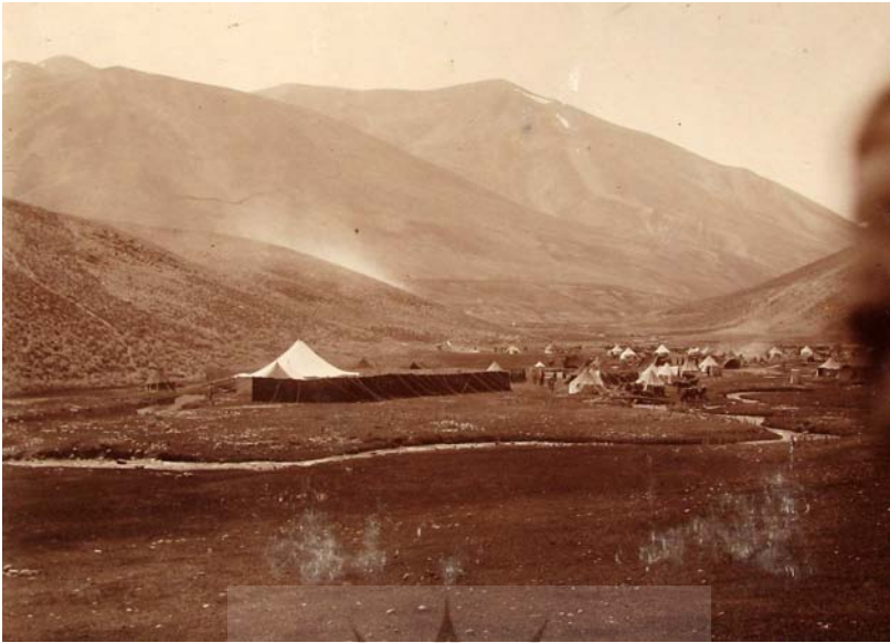
اردو در بایندور.