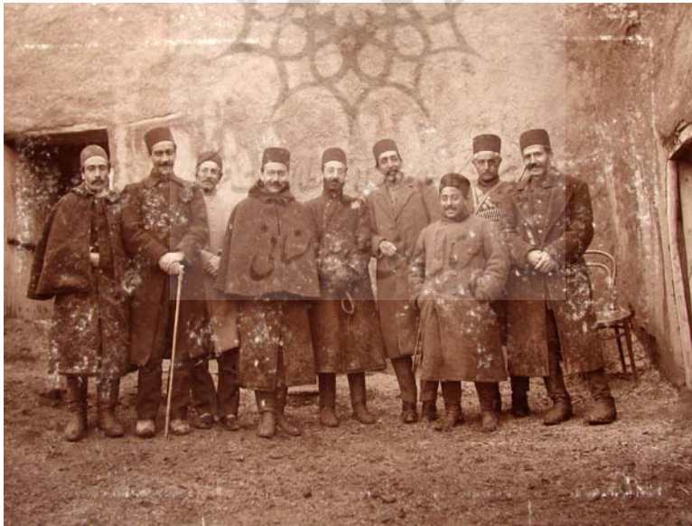
مراجعت از قراچه‌داغ در ده خواجه جمادی‌الثانی ۱۳۳۴.