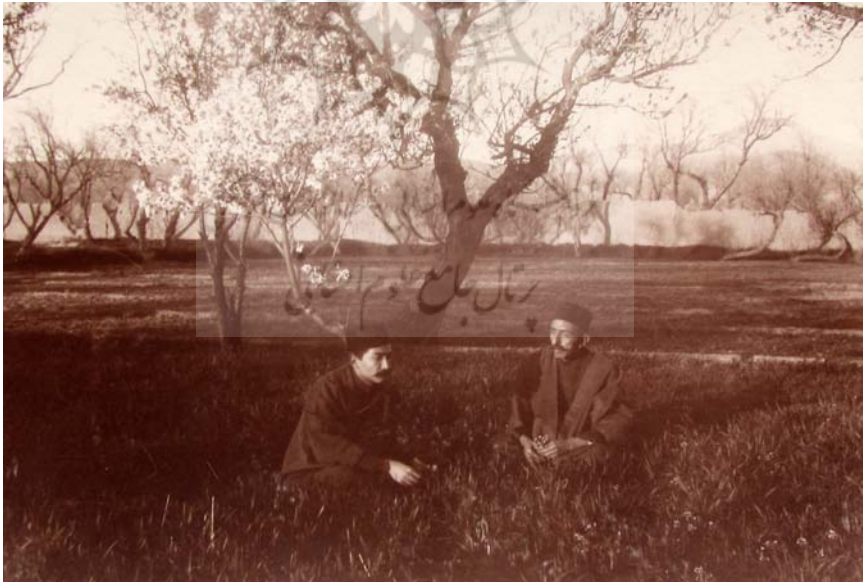
تبریز، کنار رودخانه اجی، ۱۳۳۳.