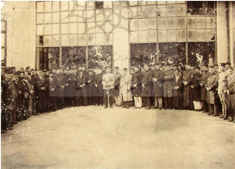
روز مهمانی سپهسالار اعظم.