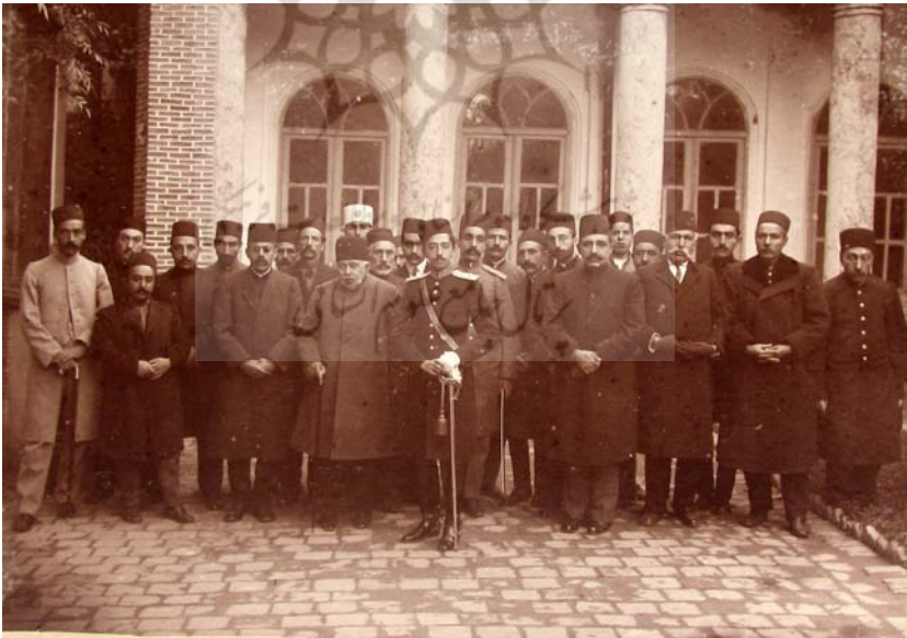
منزل آقای اعلم‌الملک در تبریز ۱۳۳۳.