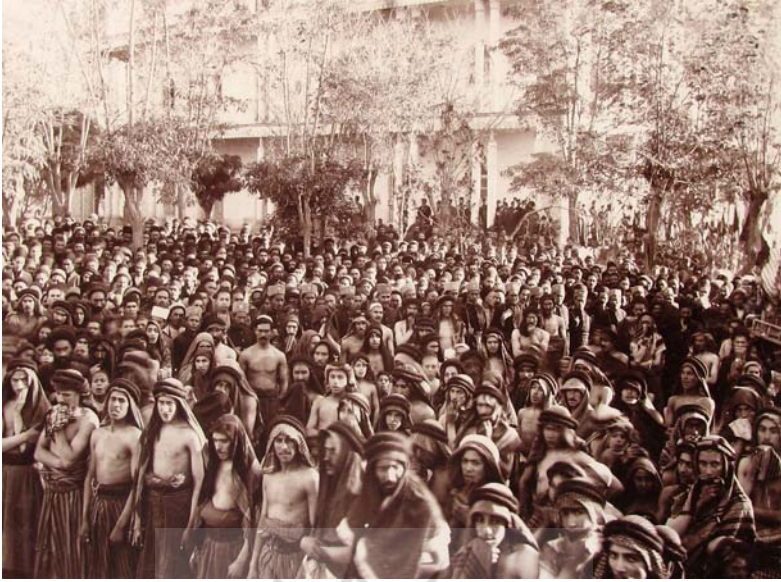
ایام عاشورا در تبریز، عمارت عالی قاپو ۱۳۳۴.