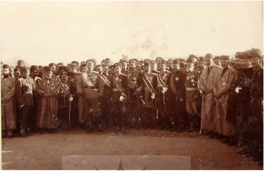
تبریز، گار [ایستگاه] راه آهن موقع ورود گراندوک بوریس ولادیمروویچ.