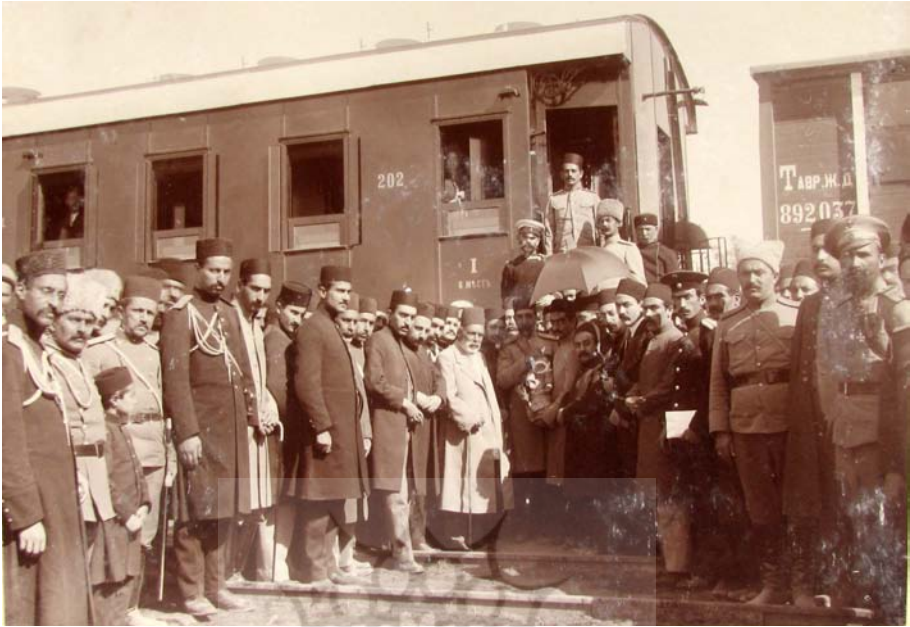
اعزام شاهزاده محمدحسین میرزا به آدسا پسر محمدحسین میرزا ولیعهد است.