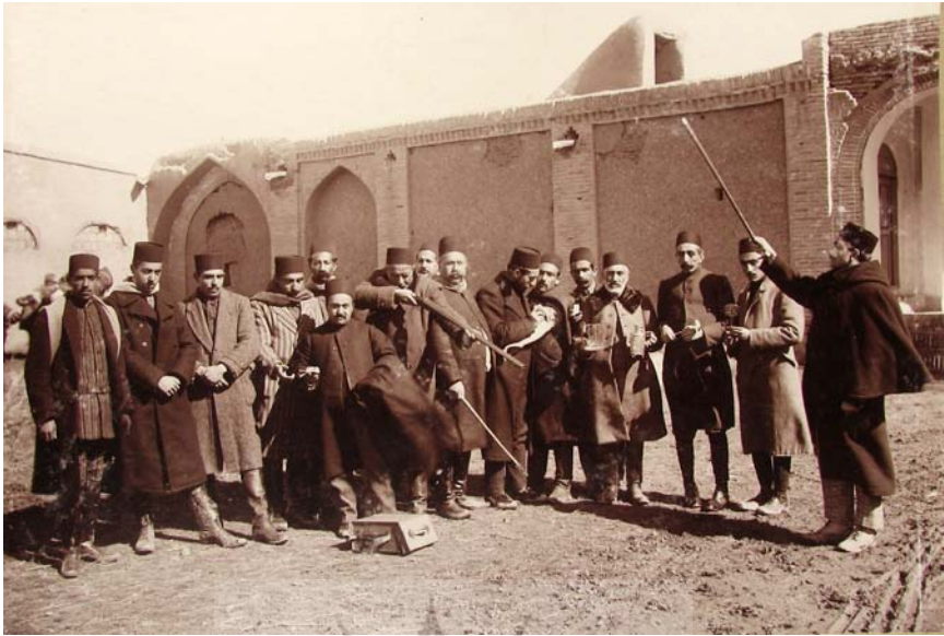
بین طهران و قزوین مهمان‌خانه حصارک، جمادی‌الثانی ۱۳۳۴.