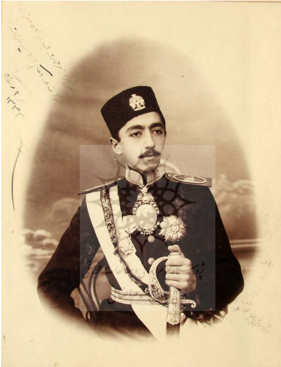
محض بروز مرحمت به شاهزاده معزالدوله [محمدصادق میرزا] خوانسالار و حاکم ارومیه مرحمت شد. ۲۸ رمضان ۱۳۳۳.