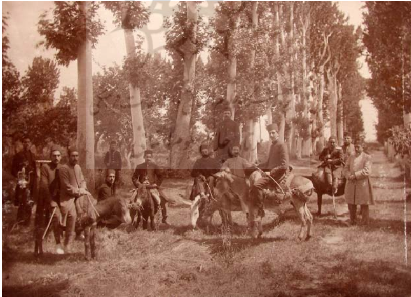
آذربایجان خیابان ملک‌زاده [؟] شعبان ۱۳۳۴.