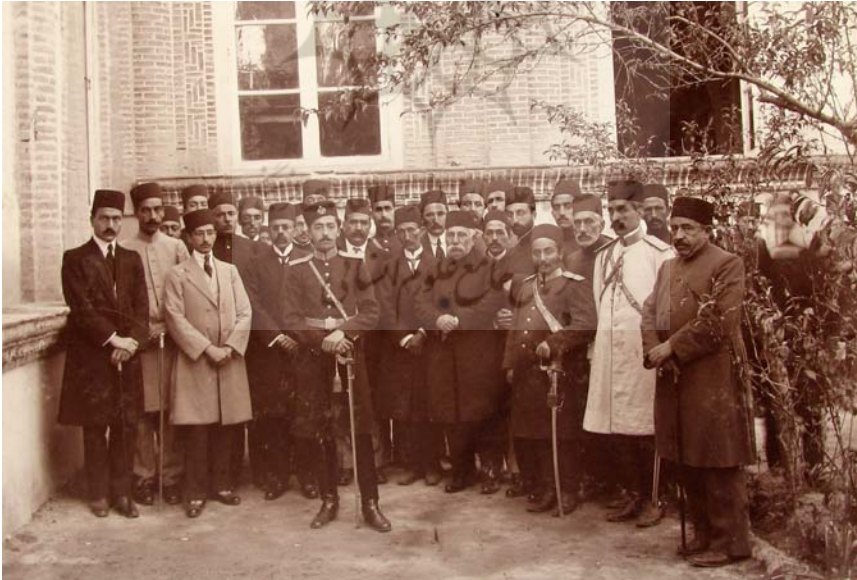
تبریز در باغ شرفالدوله رجب‌المرجب ۱۳۳۴.