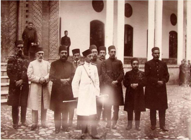
تبریز، عالی قاپو ۱۳۳۳.