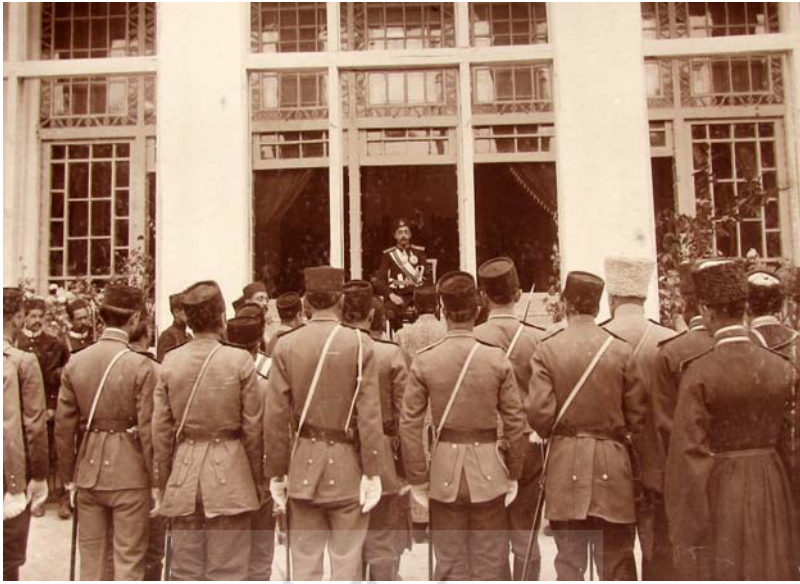
تبریز، سلام عید شاه، شعبان ۱۳۳۴.