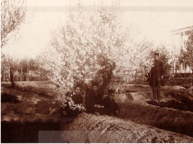
باغ سردار رشید پیشکاری گل آذربایجان، ۱۳۳۴.