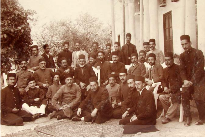
تبریز، در باغ حاجی ساعدالسلطنه فراشباشی.