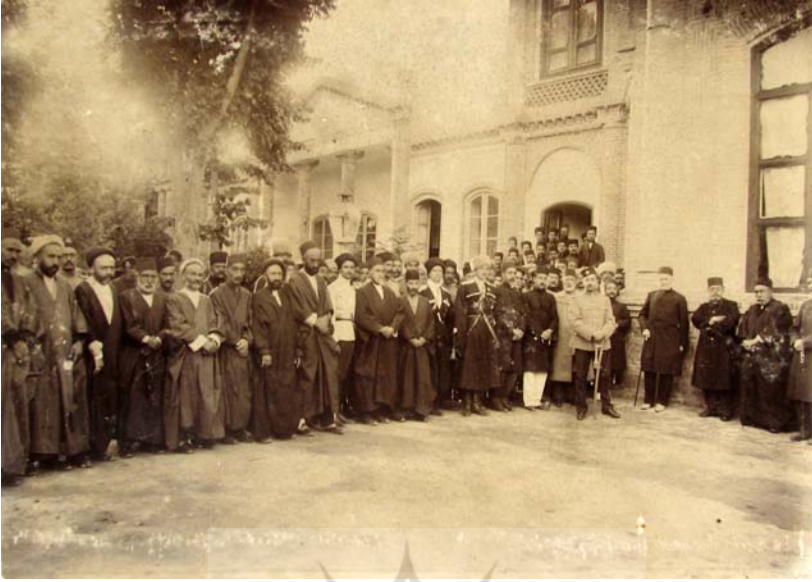
روز مهمانی سپهسالار اعظم.