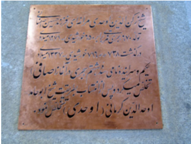
سنگ قبر قدیمی شیخ رکن‌الدین اوحدی مراغی (۷۳۸ ه.ق.).