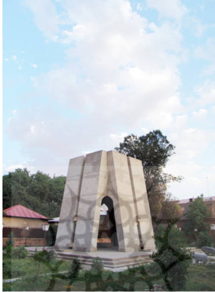
تجدید بنای مقبره اوحدی مراغه‌ای

شده و بر بالای دیواره های شمالی و جنوبی آن عبارت: «هذا قبر المولى المعظم، قدوة العلماء، افصح الكلام زبدة الانام الدارج الى رحمة الله تعالى اوحد الملة والدين ابوالحسن اصفهانی، فى منتصف شعبان سنة ثمانه و ثلثین و سبعمائة» نقر گردیده است.