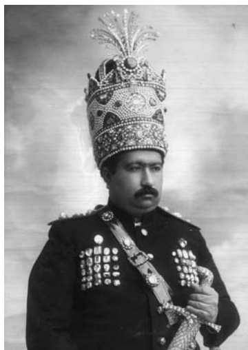
محمد علی میرزا

وی چه در ایام ولیعهدی و چه سلطنتش به واسطه نفوذ روزافزون و تسلطی که روس‌ها در ایران پیدا کرده بودند و انگلیسی‌ها از این حیث خیلی عقب‌تر بودند، بیشتر سیاست یک‌طرفه بازی می‌کرد و روسوفیل یعنی هوا خواه روس بود. به این دلیل انگلیسی‌ها از به قدرت رسیدن او راضی نبودند. ۱ بی‌اعتنایی او به نمایندگان مجلس و مخالفت با تشکیل انجمنهای ایالتی و ولایتی که در قانون اساسی پیش بینی شده بود، موجب بروز اغتشاش در سراسر مملکت و بسته شدن بازارها در تهران و تبریز شد. محمدعلی شاه به زودی در برابر این اغتشاشات خود را باخت. هیئتی در مجلس مأمور رفع نواقص قانون اساسی شد. این هیئت متمم قانون اساسی را در ۱۰۷ ماده تنظیم نمودند که مهمترین اصول مربوط به حقوق ملت و حدود اختیارات سلطنت و تقسیم قوای سه گانه در آن قید گردید. ولی محمدعلی شاه