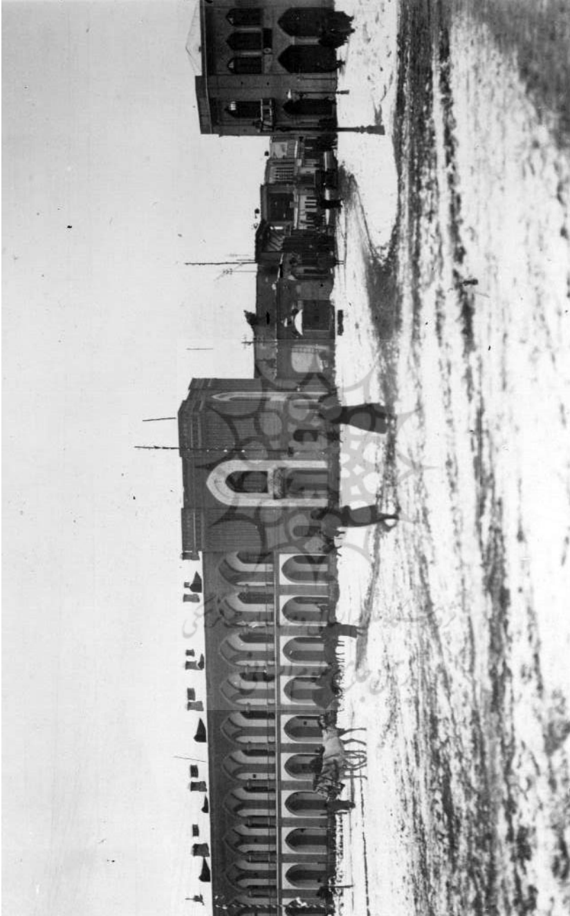
عمارت بلديه و ميدان سپه در فضل زمستان

پیام بهارستان / ۲۵، س ۲، ش ۶ / زمستان ۱۳۸۸