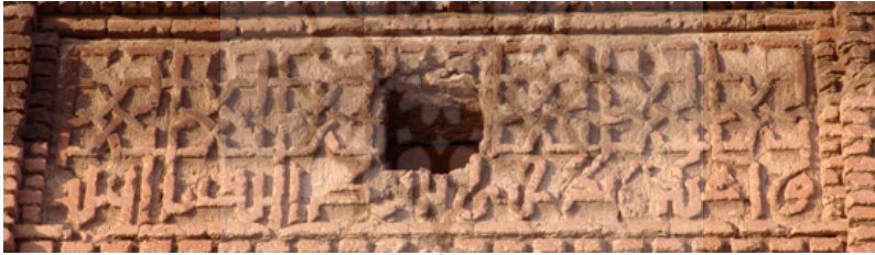
کتیبه آیات قرآنی دیواره شرقی

محتمل به نظر می‌رسد که قسمتهای تزئینی کتیبه‌ها از روی ترسیماتی که قبلاً به دقت کشیده شده بود، ساخته شده و بعضی از آنها به اندازه اصلی از روی طرحهای مرتسم با آجر نقش زده شده است. این نظریه هم با استدلال و هم از طرز عمل در دوره‌های بعد تایید می‌شود. مثلاً غیرممکن بود که یک بند کتیبه با آجر در حدود و به اندازه نغول موجود ساخت مگر آنکه قبلاً اندازه حروف و نوشته معلوم شود. در زمان حاضر سازندگان کاشی که طرحها و طرز عمل دوره‌های قبل را پیروی می‌کنند، ترسیمات را به اندازه اصلی به کار می‌برند. یک سلسله ترسیمات طرح آجرکاری که در قرن هفتم هجری قمری انجام یافته هنوز موجود است. چند صفحه از یک قرآن تزئین شده که مخصوص الجایتو نوشته شده بود، دارای طرحهای پیچیده و پرکاری است که کاملاً با تزئین گچکاری مقبره الجایتو و آثار ساختمانی گنبد آن شباهت دارد. احتمال قوی می‌رود که تزئینات این گونه نسخ خطی منبع الهام دائمی برای استادکاران ساختمانی بوده است. در دوره‌های بعد بعضی از خوشنویسان معروف هم نسخه خطی می‌نوشتند و هم طرح کتیبه‌های حاشیه‌ای ابنیه را می‌کشیدند.