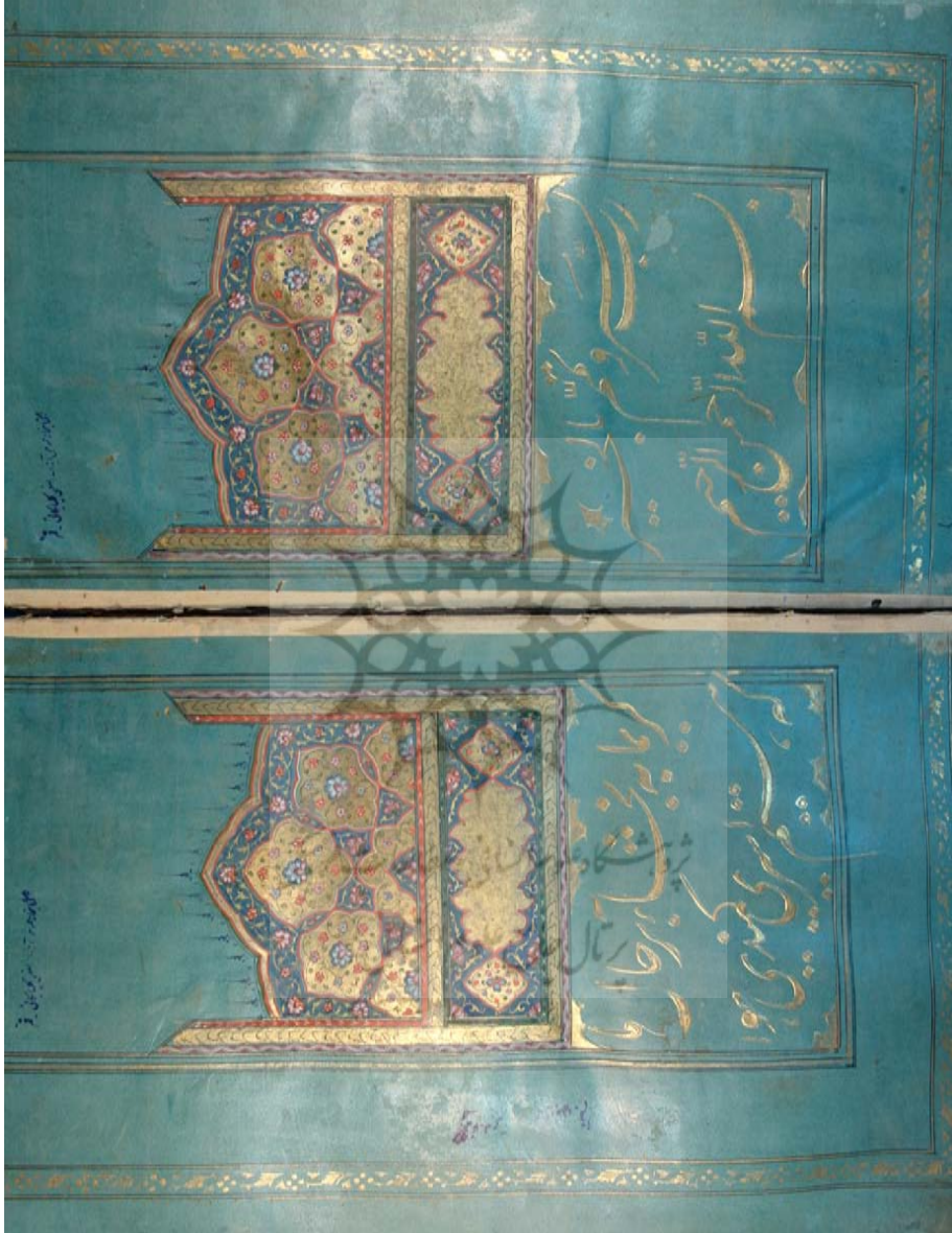
پیام بهارستان / ۲۵، س ۱، ش ۴ / تابستان ۱۳۸۸