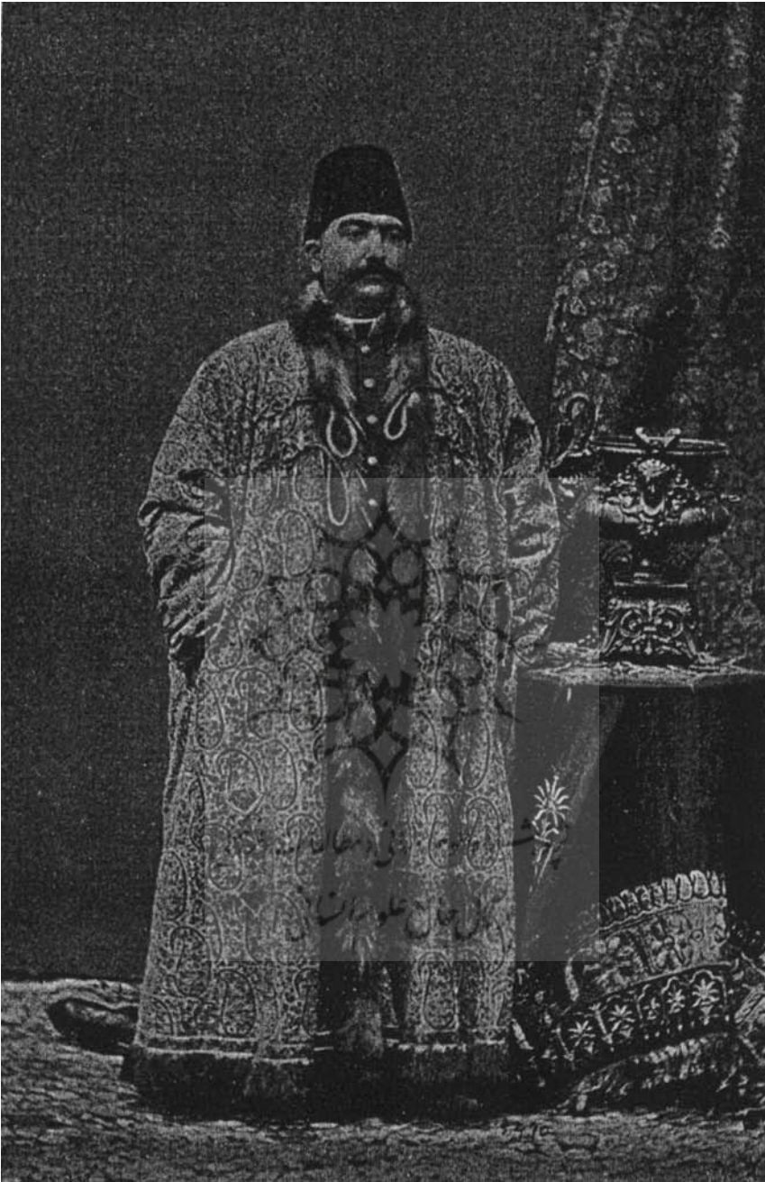
حضرت اقدس والا شاهزاده کامران میرزا وزیر جنگ