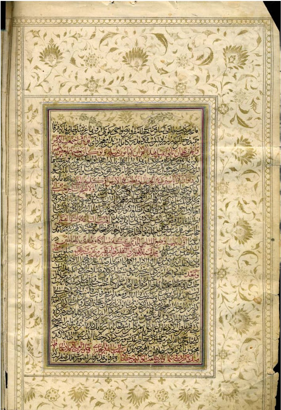
تصویر متن وقفنامه اصلی محمدحسین خان بافتی