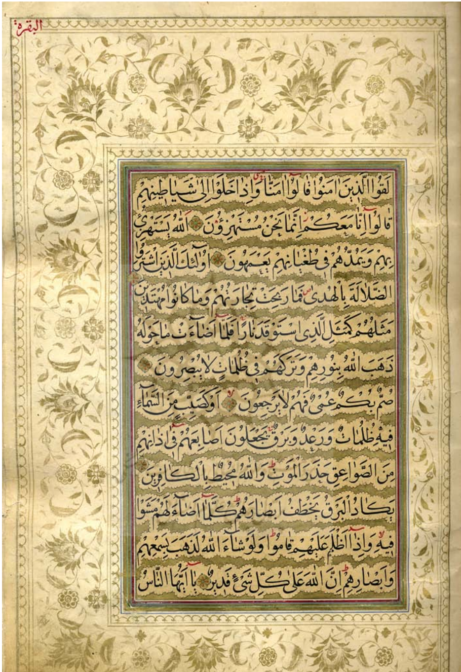
تصویر طلاندازی متن و حل کاری حاشیه