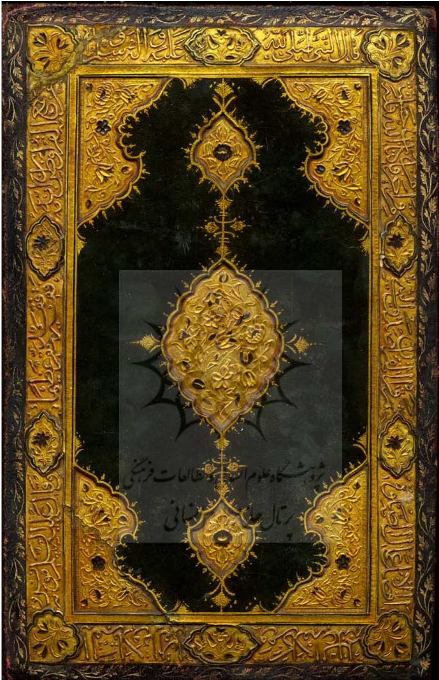
تصویر هر دو رویه‌ی جلد