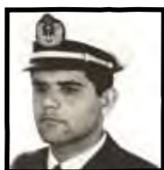
شهید زارع نعمتی