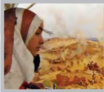
دانش آموزان پای ثابت بازدید از چنین جاهایی هستند.