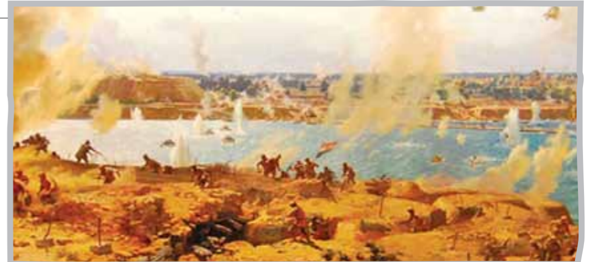
نقاشی‌های انفجار در آب و جنگ و گریز، مخاطب را با تصویری بسیار نزدیک مواجه می‌کند.