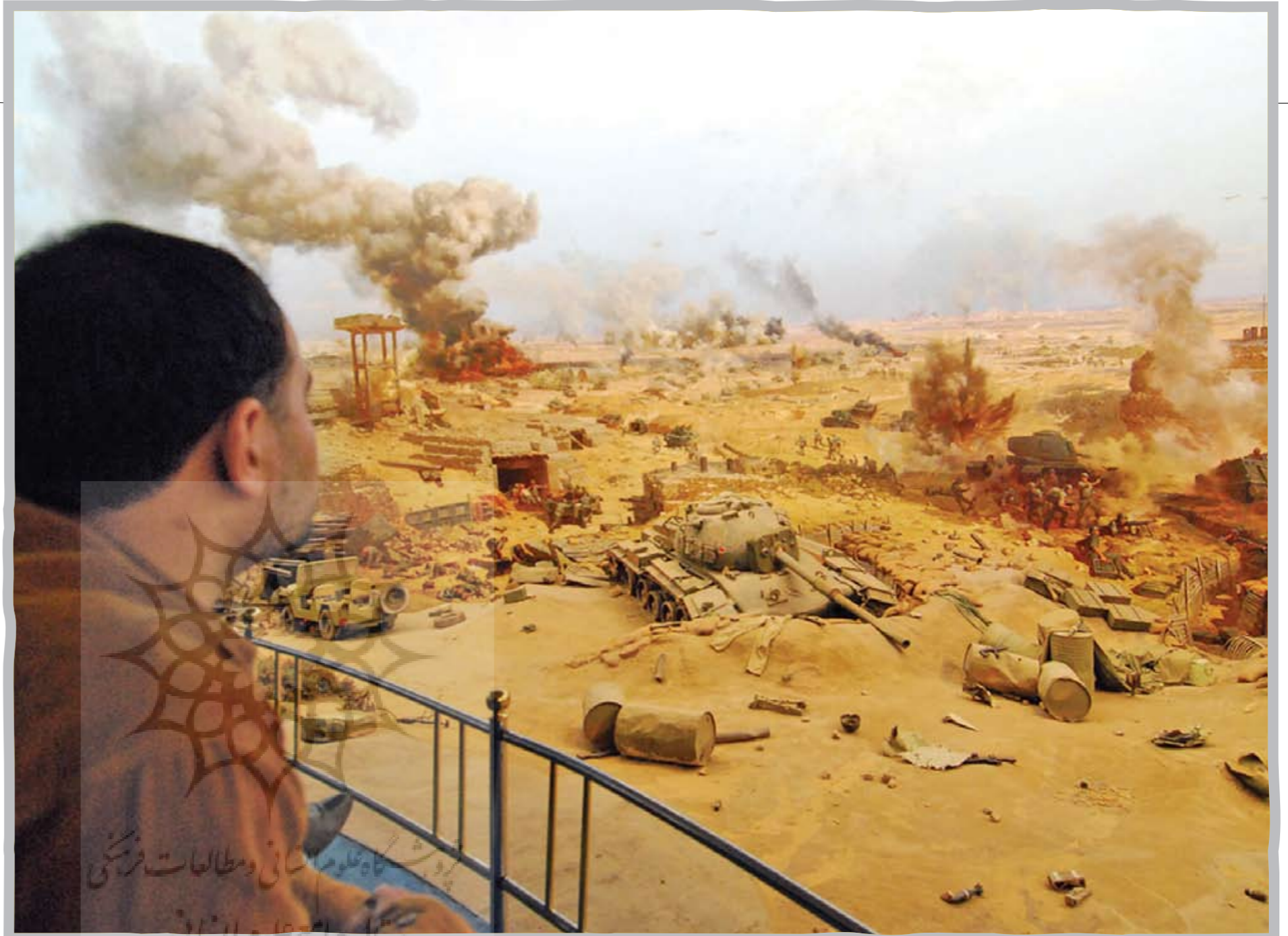
به دلیل وجود ماکت مصنوعی اشیاء در فاصله‌ای نزدیک، تشخیص دود نقاشی شده در دور دست‌ها از دود واقعی، چندان آسان نیست.