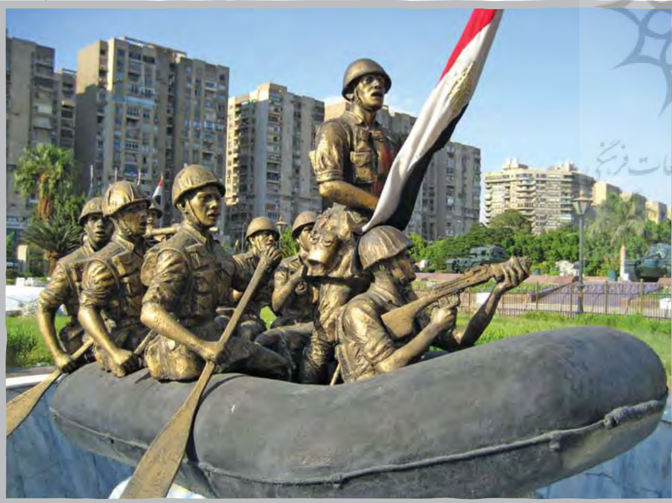
مجسمه سربازان قایق‌سوار مصری که در دست روبروی در رودی موزه پانورامای جنگ اکتبر قاهره نصب شده است

مستشارهای نظامی شوروی فرش قرمز پهن کرد. مسکو هم از هیچ چیز دریغ نکرد؛ از تعلیم نظامیان مصری گرفته تا دادن هواپیماهای میگ و موشک‌های خوف‌انگیز سام. شش سال بعد مصر حمله موعودش را شروع کرد. گلداهمه بر با سروصدا از نیکسون خواست به فریادش برسد. نیکسون برای دلداری دادن به متحد پر در دسرش ممنوعیت استفاده از بعضی سلاح‌های خاص آمریکایی را برداشت و قول داد سلاح‌های منهدم‌شده رژیم را با سلاح‌های نو جایگزین کند. دو هفته بعد، این ارتش رژیم صهیونیستی بود که مصر را زیر فشار می‌گذاشت. شوروی آخرین تیر ترکشش را هم رها و رسماً تهدید کرد که کمک مصر خواهد آمد، اما با پاسخ دندان‌شکن آمریکایی‌ها روبرو شد؛ استفاده از سلاح اتمی، شوروی تحقیر و ناچار عقب‌نشینی کرد. ماند مصر که باید یاد می‌گرفت برای جنگ باید دستش را سر زانوی خودش بگذارد. ■