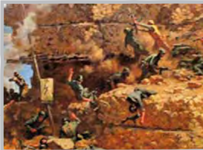
سربازان صهیونیست در راه جنوب با مقاومت شدید نیروهای مصر در تپه‌های جنیفاً مواجه می‌شوند.