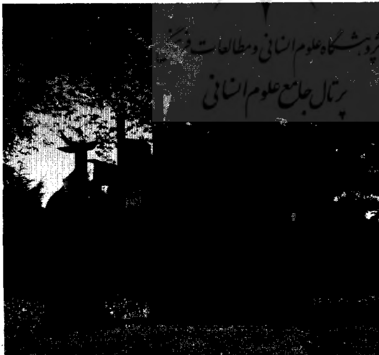
Louise NEVELSON, City on a High Mountain 1983, Black painted steel

در بیرون درست شده و خیلی بزرگ و عظیم است؛ بیشتر از ۲۰ فوت ارتفاع دارد و عریض‌ترین قطرش ۲۳ فوت است. نولسون طوری آن را طراحی کرده که از هر زاویه دیدی، جالب باشد. یک دور کامل اطراف مجسمه و مطالعه جوانب مختلف آن، ترکیب‌ها و تلفیق‌های مختلفی از شکل، خط فضا، بافت و نور را ارائه می‌کند. با اینکه این مجسمه رنگ تیره‌ی مایل به سیاه زده شده انگاره‌های نور و سایه با گذشت