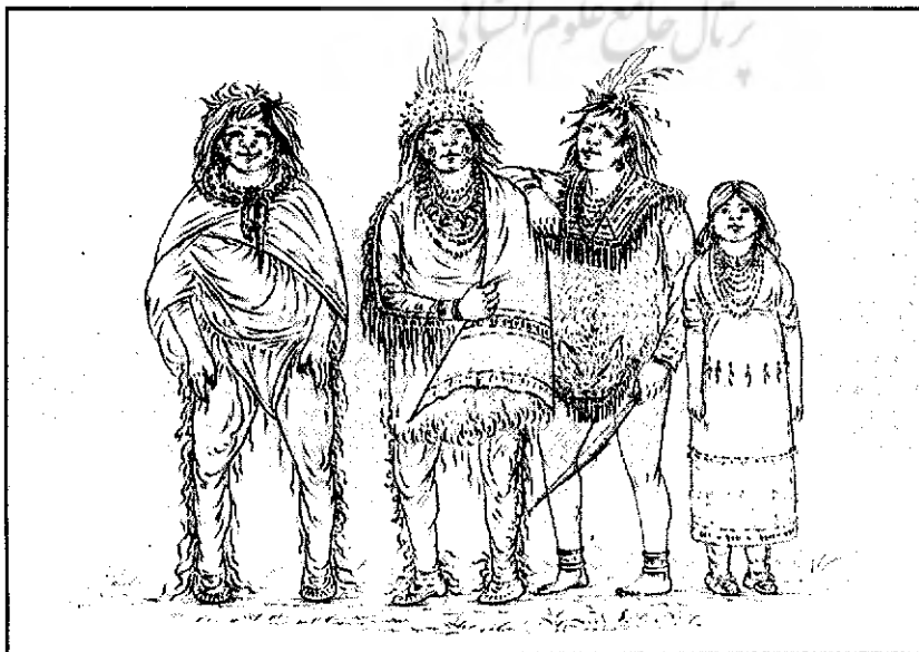
George CATLIN (1796-1872), Dogrib Indians, Outlines of North American Indians by George Catlin, 1858-1869. Pen and ink, lent by the New-York Historical Society

در سال ۱۸۵۳ ایستمن «رمان زندگی سرخ پوستان» را با ۱۲ رنگ که موضوعات آن توسط همسرش نوشته شده بود و «پرونده بومیان» را با ۳۶ گراور و متن منتشر نمود. او آنگاه بلافاصله ولی آرام در تهیه «چیکورا و سایر نواحی فتح شده و فتح نشده» مشارکت نمود. سپس جنگ آغاز شد و ایستمن به خدمت سربازی بازگشت و در پایان جنگ بازنشسته شد و ماموریت افتخار آمیز نقاشی‌های اتاقهای جلسات ساختمان کنگره ایالات متحده آمریکا را به وی واگذار نمودند که تاکنون آن نقاشی‌ها در جای خود باقی است. افسانه دستیابی به غرب جدید مردم شرق اقیانوس اطلس را به این سو جلب نمود و از میان کسانی که از دنیای قدیم به آمریکا آمدند، الکساندر فیلیپ ماکسی میلیام، شاهزاده یک منطقه سلطان نشین در اطراف