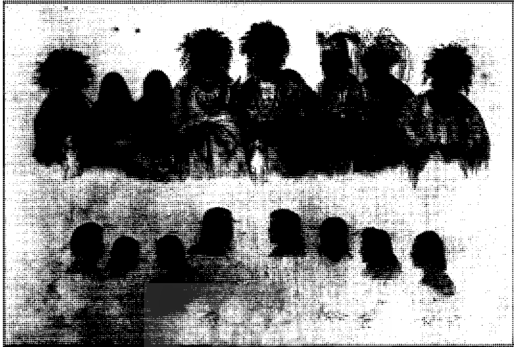
George CATLIN (1796-1872), O-jib-be- ways., Outlines of North American Indians by George Catlin, 1858-1869. Pen and ink, lent by the New-York Historical Society

سمبل‌ها و داستانها به همان سرعتی که در مخیله ما نقش می‌بندد محو شدنی نیست. مورخان، نویسندگان، شاعران و فیلمسازان به کار خود در این باره ادامه می‌دهند و ما در تخیل خود آنها را بازسازی می‌کنیم و غرب قدیم هنوز سرزمینی است که هرگز نبوده است.