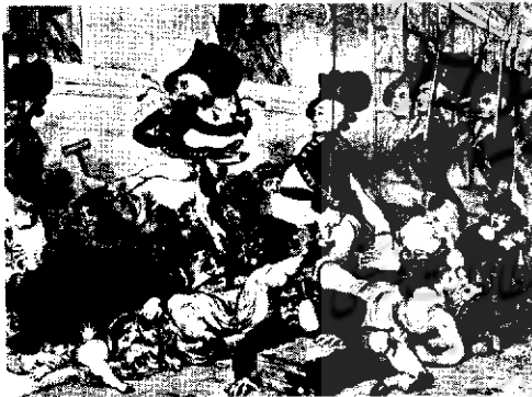
«مارش نظامی به سوی بانک»، اثر جیمز گیلری، گراور، ۱۷۸۷، ۲۱x۵۱ Cm، موزه بریتیش، لندن. موضوع این کاریکاتور مربوط به گارد مسلحی است که پس از شورش های «گوردون» در سال ۱۷۸۰ روزی دو مرتبه به محل اعزام شده و تا بدان روز نیز این رسم غیر ضروری را حفظ کرده بودند. سربازان متکبری که برای کشودن راهشان رهگذران خیابان را از سر راه هل داده و یا برای ادامه راهشان به آنان تنه می زدند، موجبات شکایت مردم آن ناحیه و فراهم ساخته بودند. اما به هیچ یک از اعتراضات رسمی نسبت به عمل گستاخانه آنان ترتیب اثری داده نشد.

در اواسط قرن نوزدهم مردم انگلیس که علاقه کمتری نسبت به کاریکاتورهای گزنده و زشت و زننده سیاسی نشان می دادند، روبه سوی مضامین اجتماعی شاد و خنده آور آوردند. (از این میان می توان به آثار «چارلز کین» (Charles Keene) و «فیل می» (Phil May) اشاره نمود). برای نخستین بار ماهنامه کاریکاتور