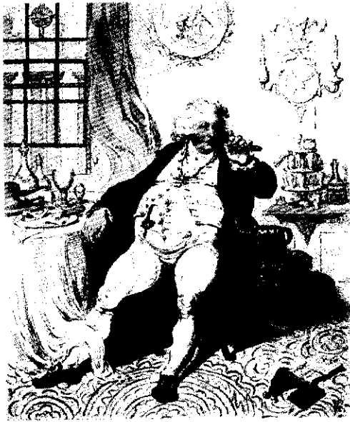
«خوشگذران»، اثر جیمز گیلری، گراور، ۱۷۹۲، موزه بریتیش، لندن. این فرد عشرت طلب و خوشگذران که نگران وضعیت گوارش و هضم خود است پرنس ۳۰ ساله ویلز است که در منزلش، در قصر کارلتون، با مجموعه ای از عادات و علایق خود احاطه شده است. او بعدها لقب جورج چهارم را یافت.