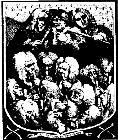
«مجالست مأموران کفن و دفن»، اثر ویلیام هوگارت، گراور، ۱۷۳۶، ۲۲x۱۸ Cm، موزه بریتیش، لندن. تبلیغ این اثر تحت عنوان «پزشکان دروغین در جلسه مشاوره» صورت گرفته بود. در این تصویر سه کلاهبردار خاص هدف کار نقاش واقع شده اند. آنان از چپ به راست عبارتند از: «شوالیه» جان تیلور (چشم پزشکی)، خانم میپ (شکسته بند معروف)، و جاشوا «اسپات» وارد (از سازندگان بی صلاحیت قرص و دارو که مورد حمایت جورج دوم قرار داشت). تصویر جمعیتی از پزشکان ناشناس در زیر، بیانگر ریاضت و طبابت قلبی در حرفه پزشکی است.