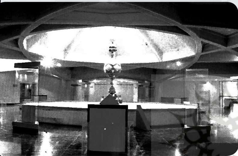
فضای اصلی تالار