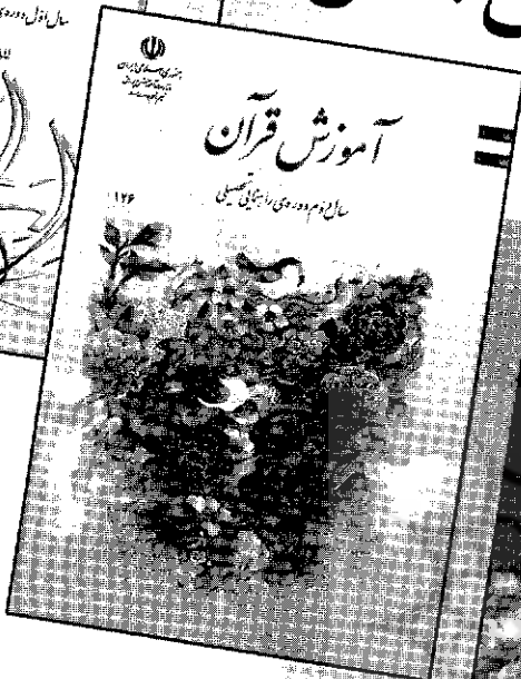
● بتول طاهر محمدی