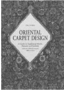
ORIENTAL CARPET DESIGN P.R.J. FORD Thames & Hudson, 1997