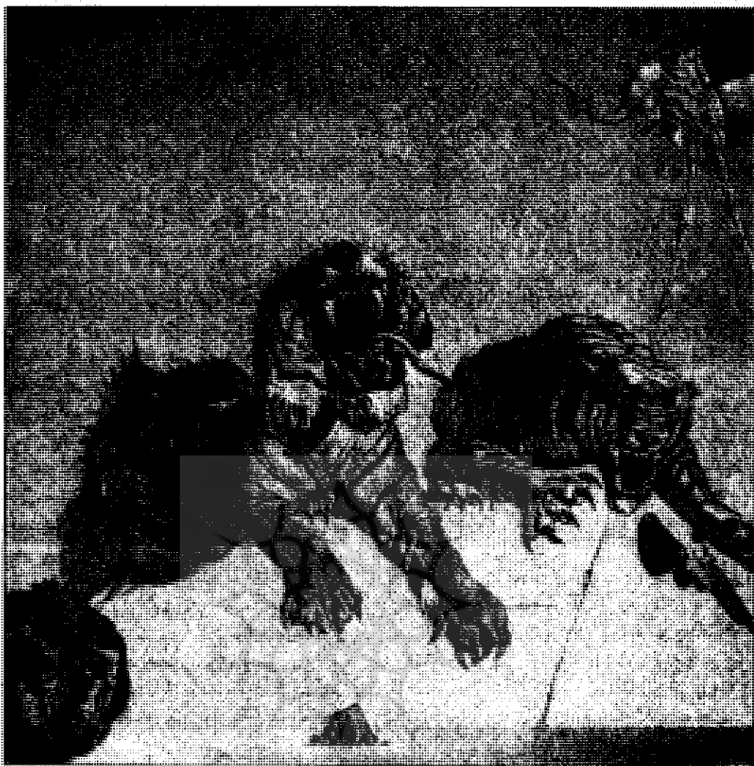
Salvador DALI REVE CAUSE PAR LE VOL D'UNE ABEILLE AUTOUR D'UNE POMME-GRENADE huile sur toile, 1944 51 x 41 cm

بسته می شود مأمنی برای مدرنیته آبستره و هندسی می باشد. نکته ایده آل در دکترین سوررئالیسم، نظم، دقت و پاکی و زلالی می باشد که در آن نزدیکی نقاشی، پیکره تراشی و معماری یکی از اهداف اصلی شمرده می شود. «بوهوس» اساتید معتبر را گردهم می آورد، اساتیدی چون «کاندینسکی»، «کلی»، «اشلمیر» (S. chlemmer)، «فنینگر» (Feininger)، «آلبر» (Albers)، «موهولی - ناکی» (Moholy) (Nagy) و معمارانی چون «گروپیوس» (Gropius) و «می وان در روش» (Mies Van der Roche). ابتلای جامعه آلمان به بحران های شدید اجتماعی، سیاسی و اقتصادی، بعد از پایان جنگ جهانی، موجب پیدایش نهضتی حیرت آور می شود که هم در قالب رئالیسم و هم در قالب شکل تشدید یافته اکسپرسیونیسم جای