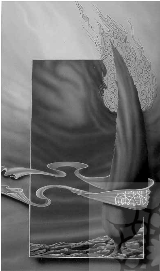
ت-۱. عروج، مجید قادری، ۱۳۶۵