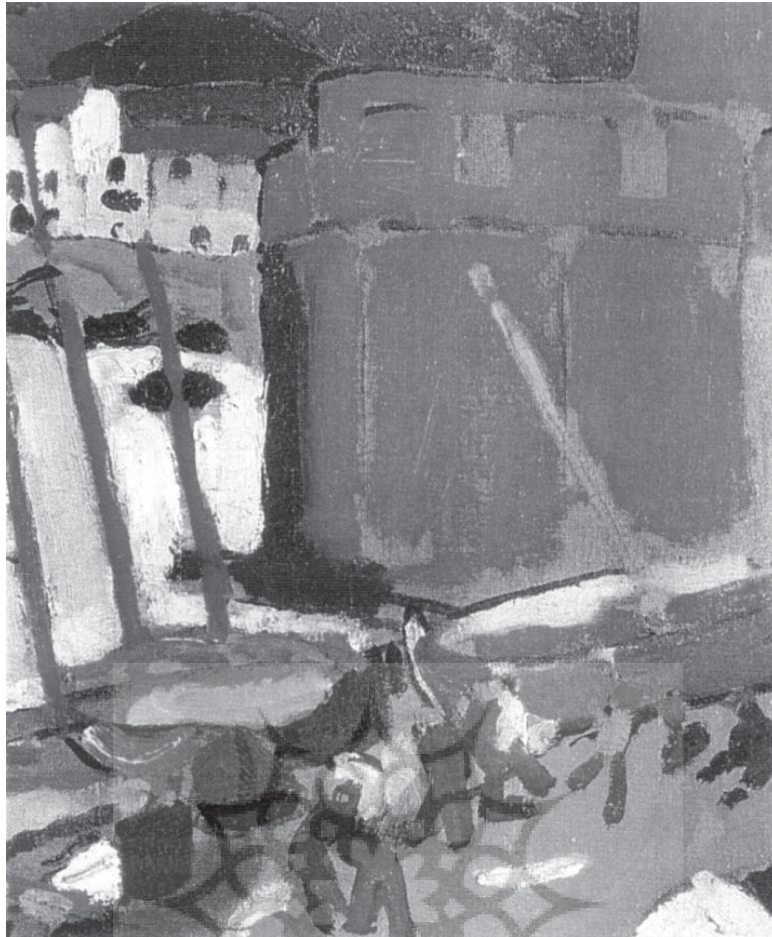
یک دیوار دنداندار که با خطوط نازک آبی مشخص شده است و یک سطح قرمز که خط سبز یک بادبان بر روی آن می‌لغزد. سمت راست تابلو را می‌بندد. دیوار، پایان‌بند ترکیب‌بندی است و نگاه را به درون اثر برمی‌گرداند، جایی که چند لکه‌ی رنگی به سادگی بیکرها را نمایان می‌سازند.

بالا و پایین اثر برقرار می‌کند. بنابراین نقطه پایان این ترکیب‌بندی گازانبری در سمت راست است. همان جایی که شکافی که آب برای خود باز کرده با قدرت بسته می‌شود و این همانا روشن‌ترین (درخشان‌ترین) منطقه‌ی تابلو است که در محاصره‌ی رنگ‌های خالص‌تر قرار دارد.