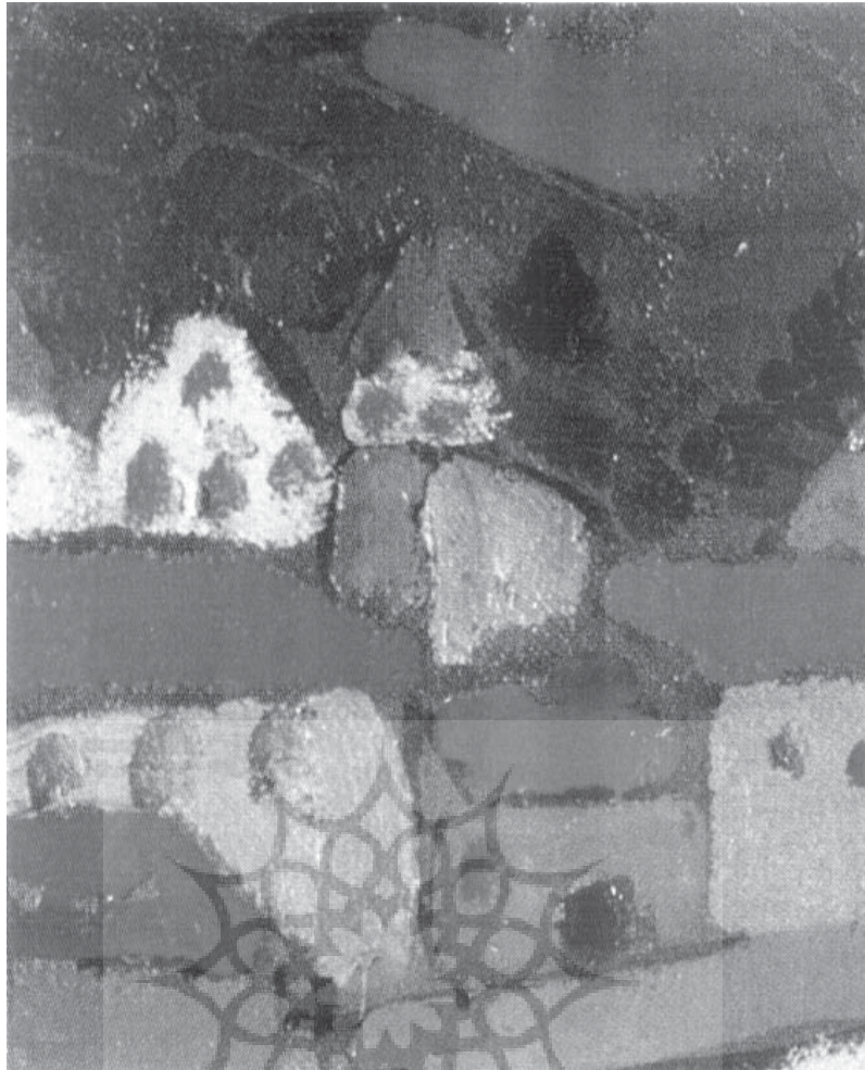
استفاده از سنگچین‌هایی به رنگ ناب با نقطه‌هایی که نشان‌دهنده‌ی در و پنجره‌اند، برای تداعی خانه‌های دهکده کولیور