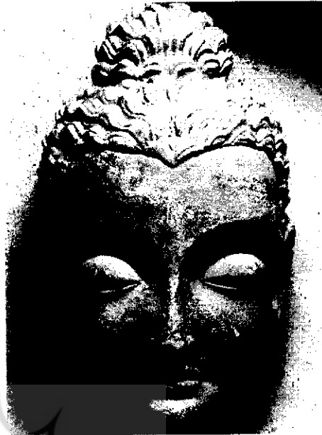
سربودا، از تاکسیل، پاکستان، قرن دوم میلادی.

فهم عام‌مان به ما می‌گوید که اجزا وابسته به یکدیگرند و همه مبتنی بر کلند. اما آموزه (ژ: 禪 کیو) به اصطلاح کامل و تمام مکتب ین دایی از این اندیشه فراتر می‌رود و کل و اجزا را یکی می‌بیند. کل عالم و تمام بوداها در یک دانه شن یا نوک یک تار مو حاضرند. بنا بر یک حکم معروف، یک اندیشه سه هزار سپهر (یعنی، کل عالم) است، و سه هزار سپهر فقط یک اندیشه است. به بیان دیگر، رابطه‌هایی که در ساده‌ترین اندیشه