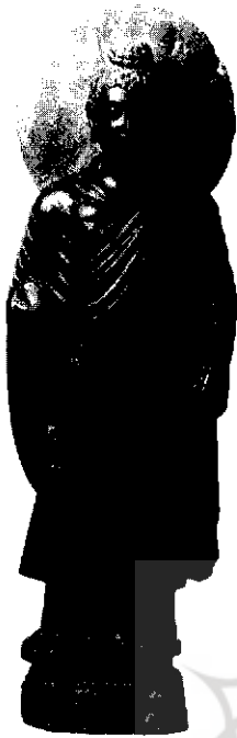
بودای ایستاده، مرمرسیاه، موزه ملی هند، دهلی‌نو. یک نمونهٔ نوعی بودای گندهاره.

دستخوش نیابندگی (سن: انیتیه anitya؛ ژ: مؤجؤ mujō) است. از این رو، ادعای تعلقی چیزی به خود و یا اظهار این که خودی (سن: آت‌من atman) هست ناممکن است. بوداییان هستی آت‌من را، که موضوع شناخت اوپه‌نیشدها (Upanishad) و سایر مکاتب فلسفی است، و نیز دویی میان جهان ذهنی و عینی را انکار می‌کردند. بنا بر نظر آنان، دژمه‌های گوناگونی بر هستی بالفعل حکمروایی دارند؛ در واقع، تمام باشندگان با مقید و مشروط شدن از طریق علت‌های بی‌شمار به هستی می‌آیند. وجود پریشان و دردآلود ما از علت‌های گوناگون ریشه می‌گیرد، و اگر آن علت‌ها خاموش شوند،