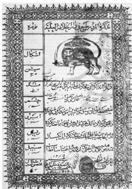
شکل ۱ تذکره ایرانی دارای نشان شیر و خورشید

قدیمی‌ترین تذکره (گذرنامه) رسمی باقی‌مانده به سال ۱۲۶۷ هجری قمری برمی‌گردد. در این زمان به دستور میرزا تقی‌خان در اراک تذکره‌خانه دایر گشت. در سال ۱۳۰۵ هجری