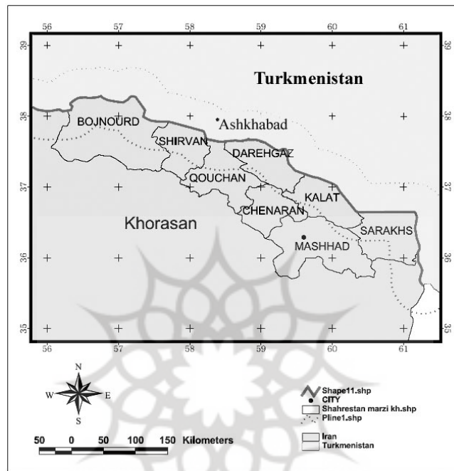
نقشه ۲ منطقه مورد مطالعه (نوار مرزی شمال خراسان)

بدین ترتیب شایسته است مسؤولین دو کشور با تجدید نظر اساسی و حل مشکلات اندکی که در کنار اجرای این طرح ایجاد شده است، زمینه بهره‌مندی مطلوب و مفید مرزنیسان را از تسهیلات آن بیش از پیش فراهم نمایند.