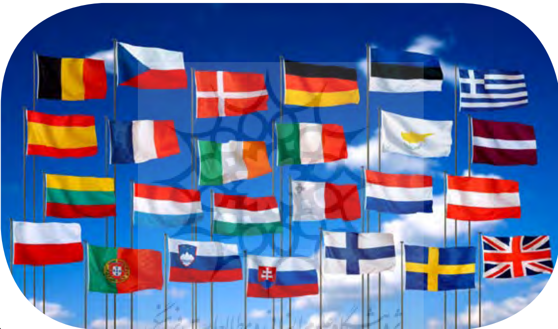
سمیرا بیات سرمدی کارشناس ارشد اقتصاد - منصوره عباسی کارشناس ارشد اقتصاد