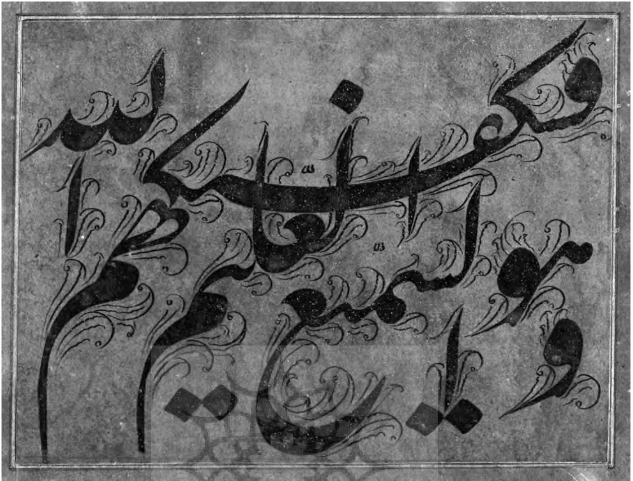
ملک محمد قزوینی - موزه‌ی رضا عباسی