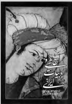
نقاشی و ادبیات ایرانی