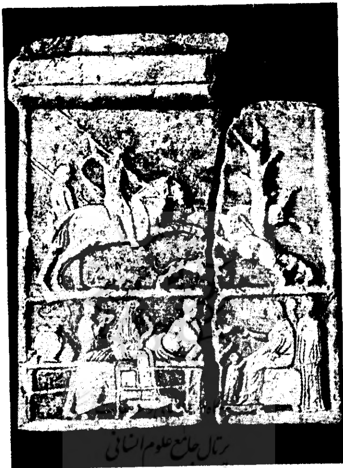
شکل ۳ و ۴- صحنه شکار و ضیافت مکتوف اژدهکده چاوش کوی (آسیای صغیر)

عکس از : رمان گیرشمن هنر ایران در دوران پارت و ساسانی . ترجمه دکتر بهرام فره وشی تهران ۱۳۵۱