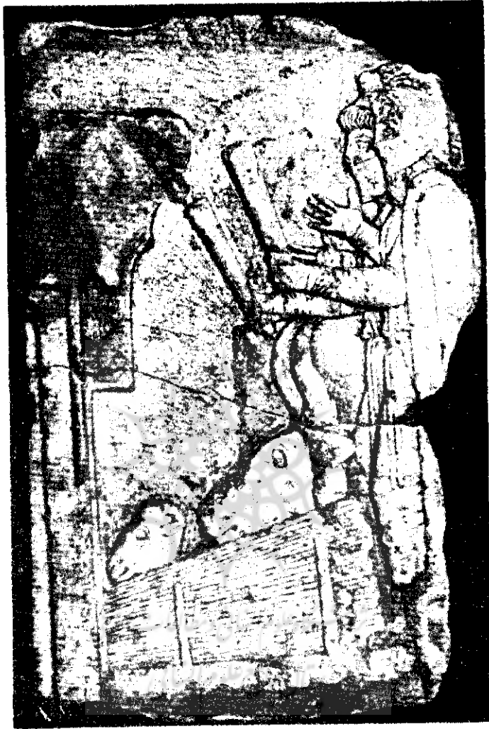
شکل ۱- مراسم قربانی مکشوف از دهکده ارگیلی (داسکیلیوم). عکس از : رمان گیرشمن هنر ایران در دوران ماد وهخامنشی . ترجمه دکتر عیسی بهنام تهران ۱۳۴۷ صفحه ۳۴۷ شکل ۴۴۰ .