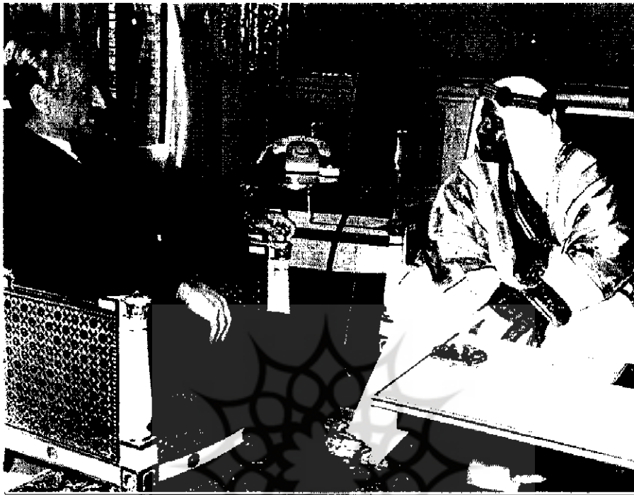
عیسی بن سلمان آل خلیفه امیر بحرین در ملاقات با محمدرضا پهلوی [۲۵۹-۱۱ع]

با این حال در دوره پهلوی دوم در دو برهه زمانی مسئله بحرین به صورت جدی مطرح شد. نخستین مورد به سال ۱۳۲۹ باز می‌گردد، زمانی که لایحه ملی شدن نفت در مجلس برای تصویب نهایی ارائه شد، شرکت نفت بحرین نیز در طرح ملی شدن قرار گرفت زیرا مجمع‌الجزایر بحرین به عنوان بخشی از خاک اصلی ایران تلقی می‌شد. دومین مورد در سال ۱۳۳۶ بود که هیئت دولت با حضور شخص شاه لایحه‌ای به مجلس ارائه نمود که در آن بحرین از استان فارس جدا می‌شد و به عنوان استان چهاردهم ایران به شمار می‌آمد و دو کرسی خالی برای نمایندگان این استان در مجلس شورای ملی در نظر گرفته شد. هرچند این اقدام پس از یک سده بی‌اعتنایی نسبی، تلاش ایران را برای بازگرداندن بحرین وارد مرحله‌ای جدی ساخت، اما هم به ضرر ایران تمام شد و هم به زیان مردم بحرین. اعلام سیاست خروج ایران از آن دسته از مجامع بین‌المللی که بحرین را به عنوان یک دولت مستقل به عضویت بپذیرند موجب پیدایی دشواریهای فراوانی برای ایران، به