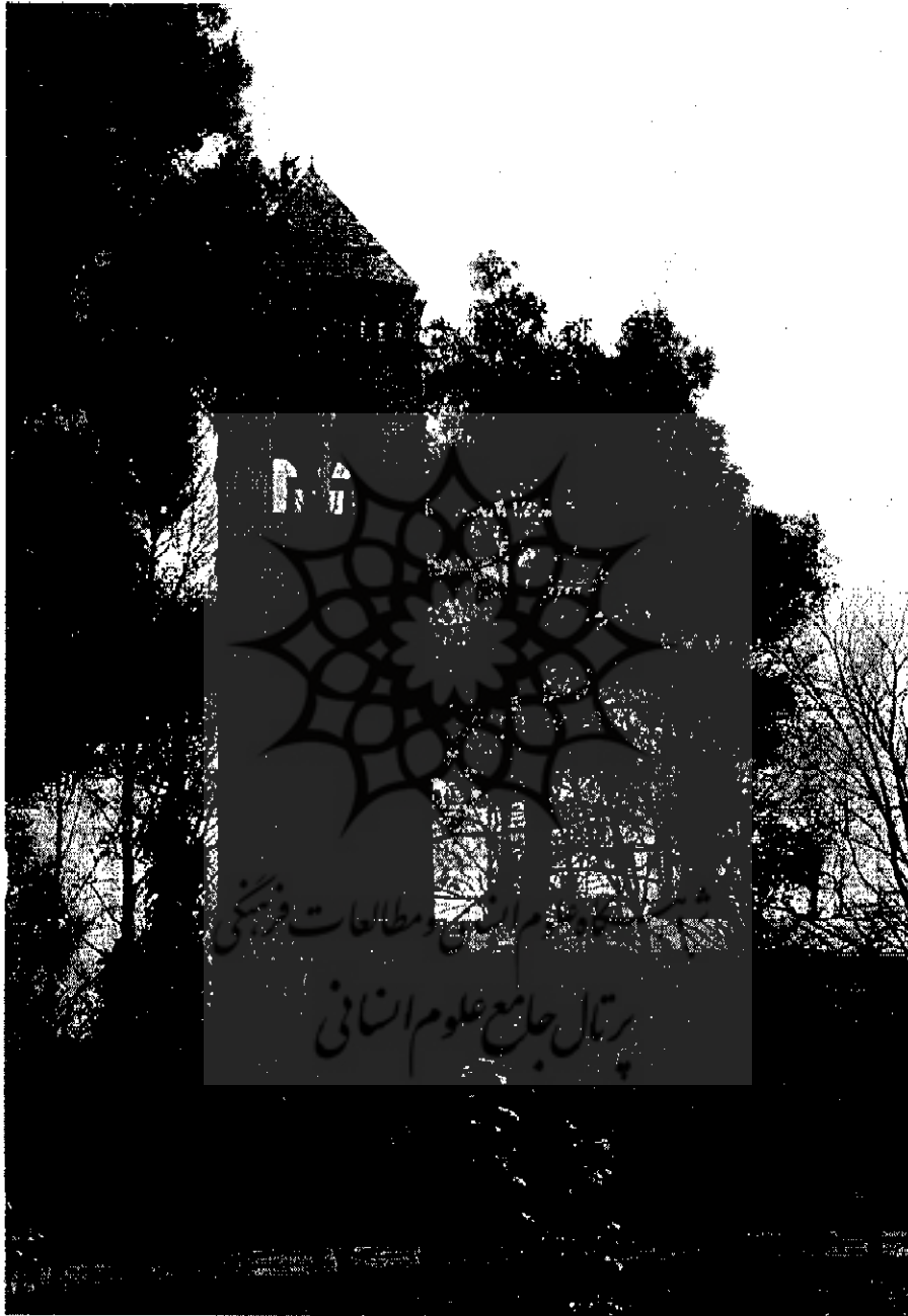
نمایی از داخل سفارت بریتانیا در تهران | ۱۰۶۶۶-۱۳