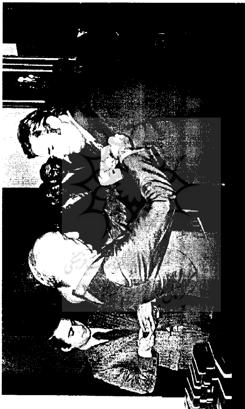
نعمت‌الله نصیری در حال اعطای نشان به کارمندان ساواک | ۵-۲۳۳۲۲۰۵