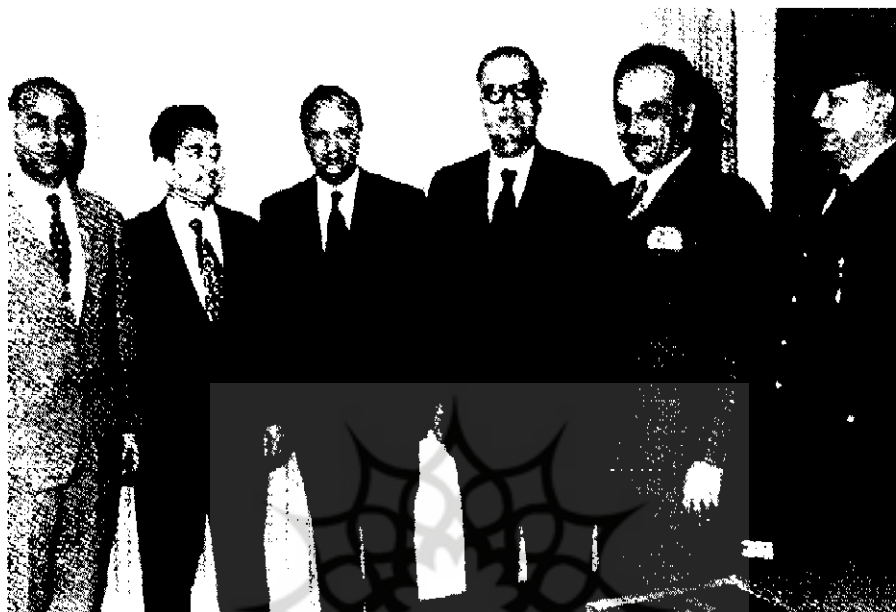
سران پلیس ایران با آباابان