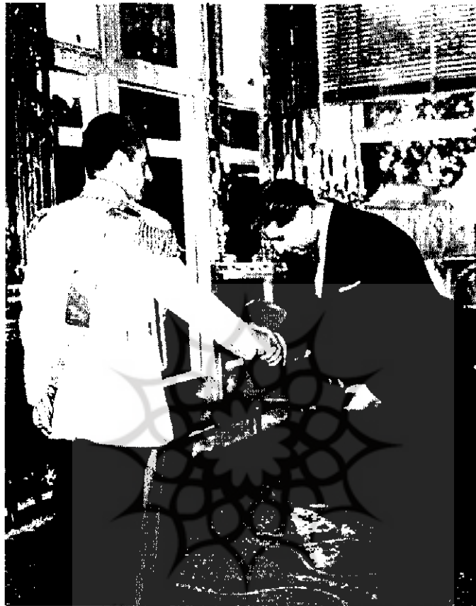
ملاقات محمدرضا بهلوی با فرستاده دولت اسرائیل (۱۳۴۷/۶/۱۹) | ۷۲۲-۷۲۱پ|

بازرگانی وابسته در تهران در سال ۱۹۵۸ انجامید که سالهای سال به تمامی فعالیتهای اسرائیل در ایران رسماً پوشش می‌داد. ۲