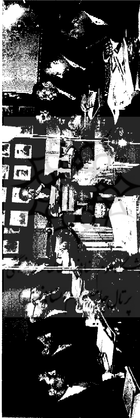
کودنای سفید (۲)